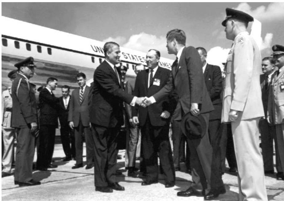
Вернер фон Браун и Джон Кеннеди

подлодок, но летом 1943 года из-за нехватки вольфрама промышленности передали запасы урана — и на этом атомная программа рейха закончилась. Впоследствии Шпеер полагал, что при максимальном напряжении сил Германия создала бы бомбу в 1947 году, а если бы на самой ранней стадии проекта уделили ему такое же внимание, что и ракете фон Брауна, то даже к 1945-му. Но на два таких масштабных проекта ресурсов не хватило бы, маленькая Германия не СССР и не США, и получается, что барон спас мир от этой жуткой реальности!