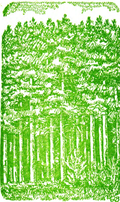
Самосев сосны (5—6 лет).