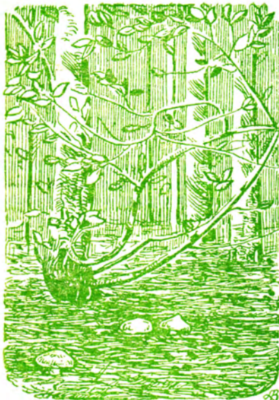
Маслята в лесу.