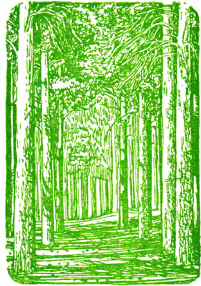
В сосновом лесу.

На песках — не только возле Камышина, но и в соседних районах — Балаклейском, Руднянском — вполне устойчива сосна обыкновенная. В