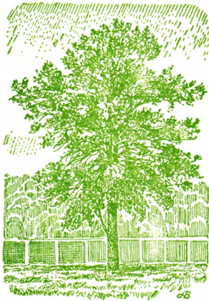
Могучий дуб на краю плодового питомника.