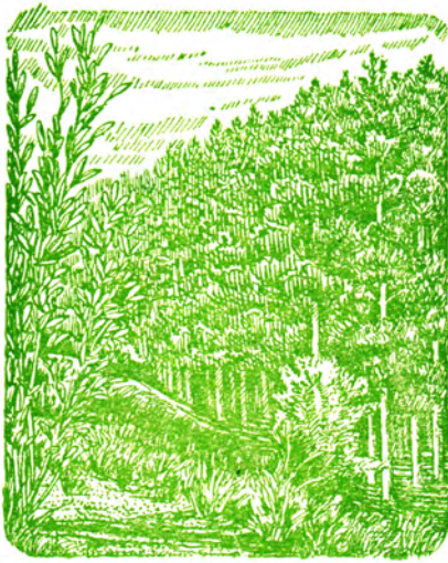
Сосна и шелюга (вид ивы — слева) на бугристых песках.