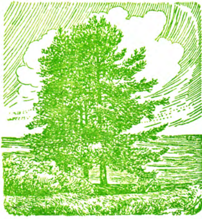
Ломоносовские сосны (60 лет).