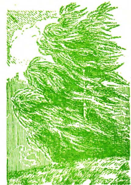
Маточная шелюга (вид ивы) на ветру.