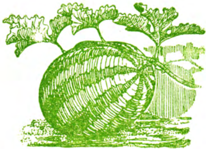
Арбуз, выращенный в Камышинском пункте.

благоприятных местах она дает прекрасный самосев молодых сосенок. Сосна прочно завоевала здесь себе место, выдвинувшись в сухие степи далеко за пределы своего естественного обитания. Значит и для сосны неверны были выводы, что ей на Юго-Востоке нет места из-за недостатка влаги.