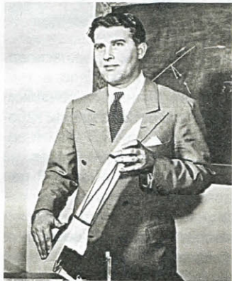
Вернер фон Браун с моделью «Фау-2» в руках

Первая «Фау-2» нанесла удар по Парижу 7 сентября 1944 года. На следующий день был обстрелян Лондон. Затем атакам подверглись другие города Европы. Было изготовлено 6 тысяч этих ракет, 4200 из них были запущены, но только 2200 достигли цели.