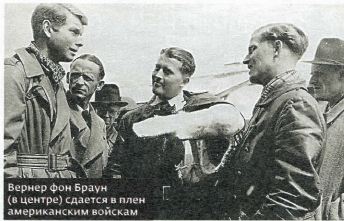
Вернер фон Браун (в центре) сдается в плен американским войскам

Действительно, как цинично подсчитали после войны, в результате запуска 4200 ракет (стоимостью по 120 тысяч марок каждая) погибло 2700 человек. То есть на одного чело-