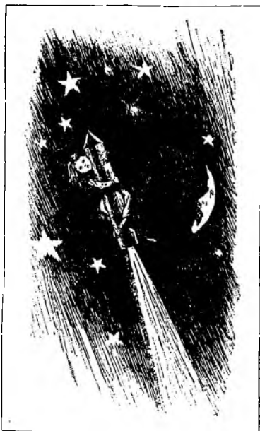
Ядро летѣло быстрѣ молніи ..

Очутился я на лунѣ совершенно неожиданно и очутился въ то самое время, когда