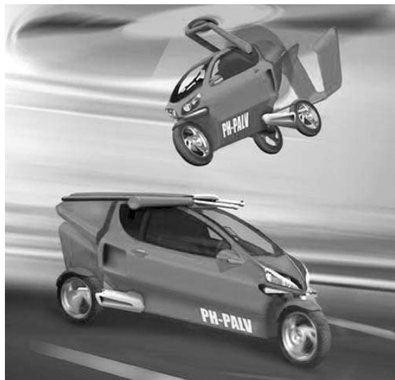
Автомобиль PAL-V может подняться в воздух на 1200 метров

Однако, очевидны и недостатки. Ведь даже при массовом производстве летающих автомобилей они будут стоить дороже обычных машин. Зато уровень шума, создаваемый ими, выше, чем привычными легковушками. К постоянному гулу, неизменно окружающему нас, прибавится еще и грохот над головой? Возрастет и цена ошибок водителей. Дорожно-воздушные аварии могут приводить к очень тяжким последствиям.