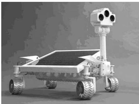
Лунный робот «Азимов» назван в честь знаменитого писателя