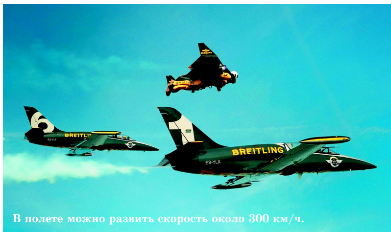
В полете можно развить скорость около 300 км/ч.