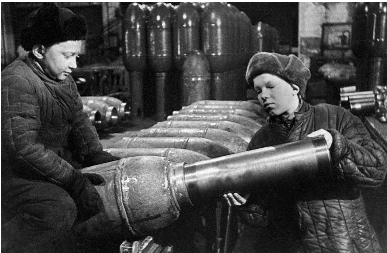
Дети изготавливают реактивные снаряды М-28. Ленинград. 1942 г.

т. к. устройство и действие зажигающей мины аналогичны действию химической мины.