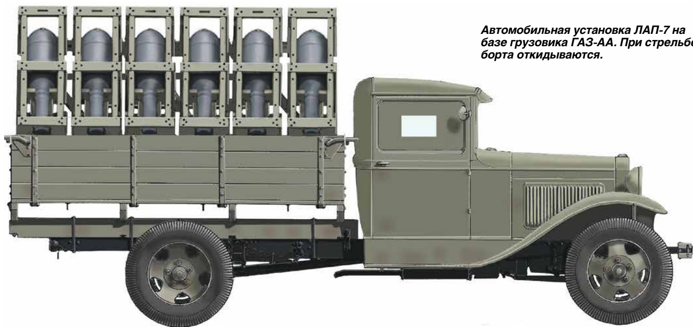
Автомобильная установка ЛАП-7 на базе грузовика ГАЗ-АА. При стрельбе борта откидываются.

Возможности М-28 и М-32 (МТВ-280 и МТВ-320) хорошо видны из отчёта об их испытаниях на АНИОПе: «Сегодня, 12 августа, на АНИОПе были проведены очередные испытания