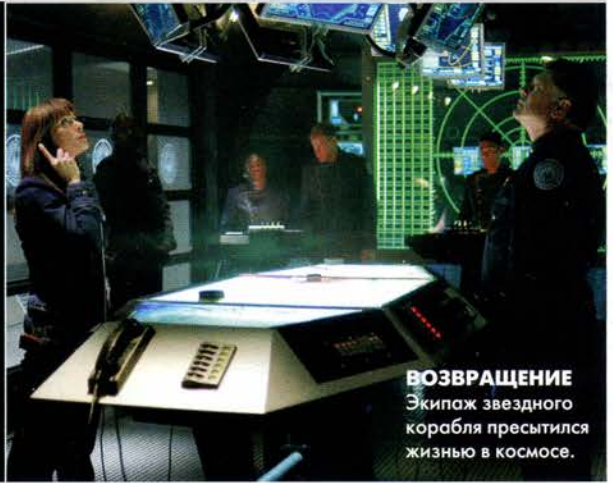
ВОЗВРАЩЕНИЕ Экипаж звездного корабля пресытился жизнью в космосе.

Э тот научно-фантастический сериал появился на экранах в 1978 году. Во всех его сериях прослеживается единая сюжетная линия. В далекой части Вселенной на планетах, известных как Двенадцать Колоний, живет некая цивилизация людей. После войны с кибернетической расой сайлонов нескольким тысячам выживших людей удалось подняться в космос на борту различных космических кораблей. Там они в безопасности под началом своего командера держат курс к сказочному приюту под названием Земля.