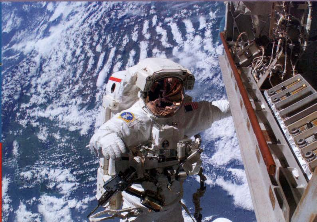
РЕМОНТ В НЕБЕ Роберт Ли Кербим (справа) вышел в космос, чтобы починить ТВ-камеру.