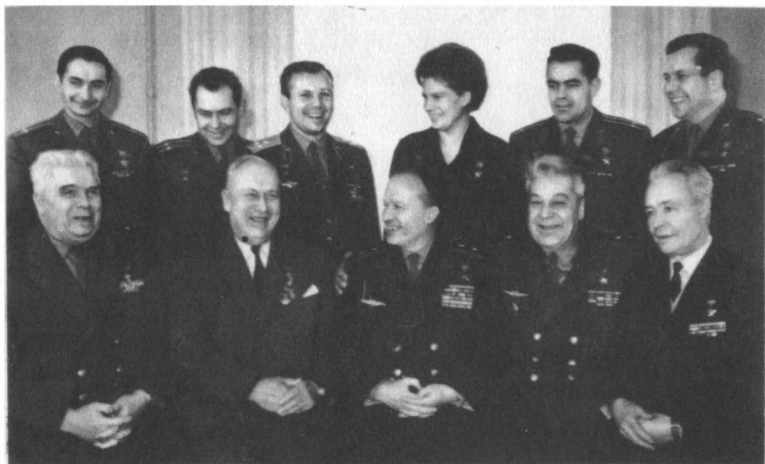
Одна из памятных встреч. Первые Герои Советского Союза — М. Водопьянов, М. Слепнев, Н. Каманин, А. Ляпидевский, В. Молоков и первые космонавты — В. Быковский, Г. Титов, Ю. Гагарин, В. Терешкова, А. Николаев, П. Попович.