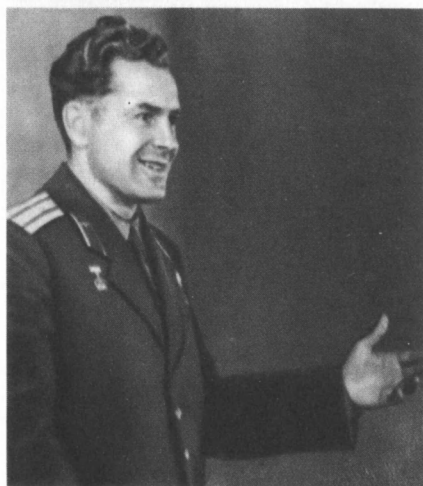
Космонавт-Два на пресс-конференции, посвященной итогам полета.