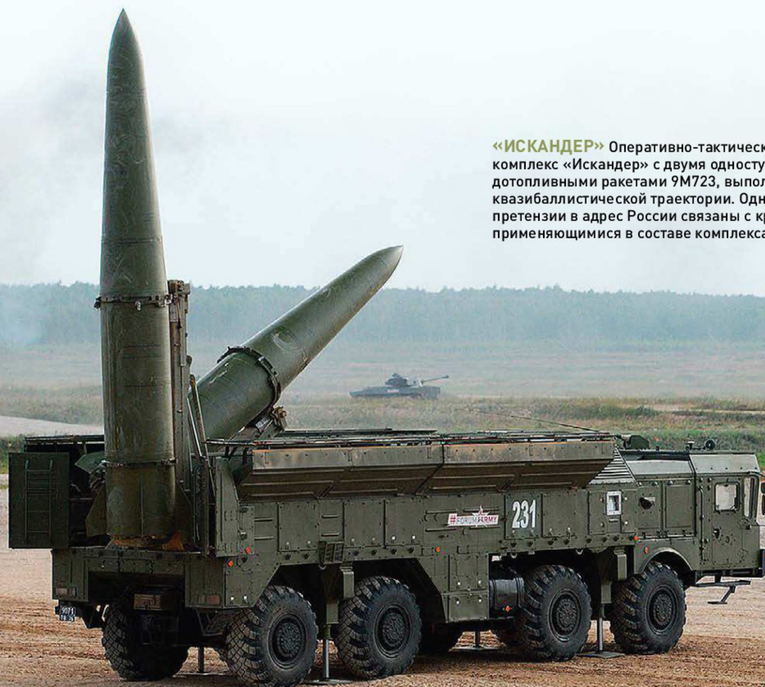
«ИСКАНДЕР» Оперативно-тактический ракетный комплекс «Искандер» с двумя одноступенчатыми твердотопливными ракетами 9М723, выполняющими полет по квазибаллистической траектории. Однако американские претензии в адрес России связаны с крылатыми ракетами, применяющимися в составе комплекса.

Претензии России касаются создания американцами в Румынии и Польше позиционных районов ПРО для борьбы с баллистическими ракетами. Система ПРО Aegis («Эгида»), включающая в себя трехкоординатные РЛС с фазированной антенной решеткой AN/SPY-1 и ракеты Standard Missile-3 с пусковыми установками Mk 41,