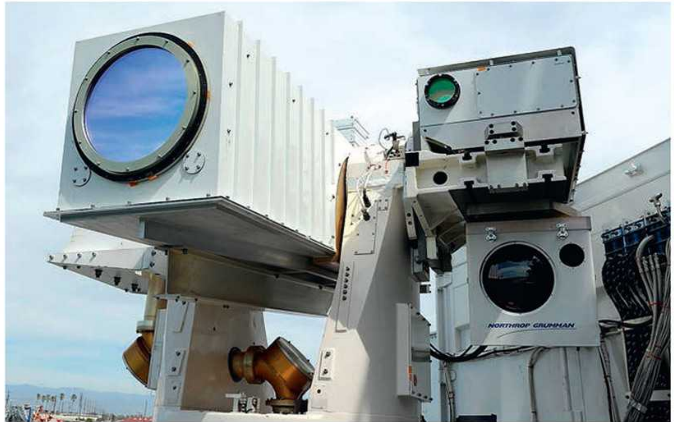
РАДАРНЫЙ ДАЛЬНОМЕР СИСТЕМА СЛЕЖЕНИЯ ЗА ЦЕЛЬЮ ВЫХОДНАЯ ОПТИЧЕСКАЯ СИСТЕМА ЛАЗЕРА