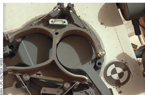
С помощью масс-спектрометра и газового хроматографа ровер способен искать в грунте следы органических веществ