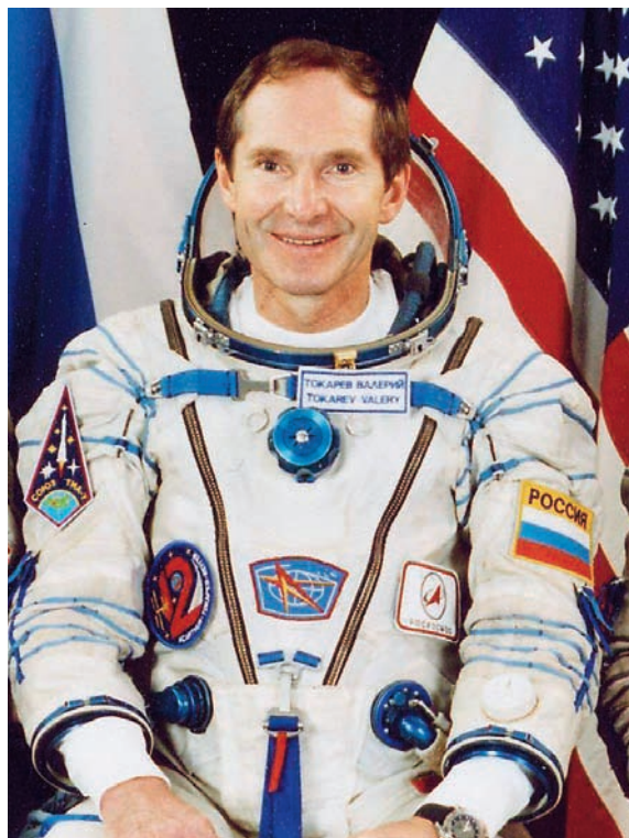
В 2005 году Валерий Токарев полгода «просидел» в космосе с американцем Уильямом Макартуром

Особняков и служебных квартир Токарев не строил, поселился у пожилой матери в двухкомнатной квартире. Половина города и района знает его сотовый телефон