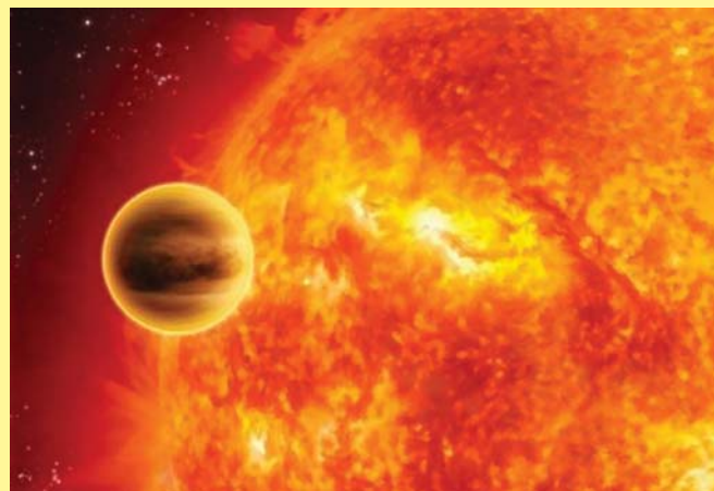
HD 149026b в представлении художника

Ровно обратная ситуация на поверхности объекта HD 149026b — одной из самых тяжелых и горячих экзопланет, где температура достигает 2000°С. Это в три раза выше, нежели температура Венеры, одной из самых горячих планет Солнечной системы. Интересен и механизм нагрева HD 149026b. По мнению ученых, планета практически полностью поглощает падающий на нее свет от звезды, за счет которого и достигаются столь колоссальные температуры. Очень высока и плотность HD 149026b — при размерах сравнимых с Сатурном ядро планеты почти в сто раз тяжелее массы всей Земли.