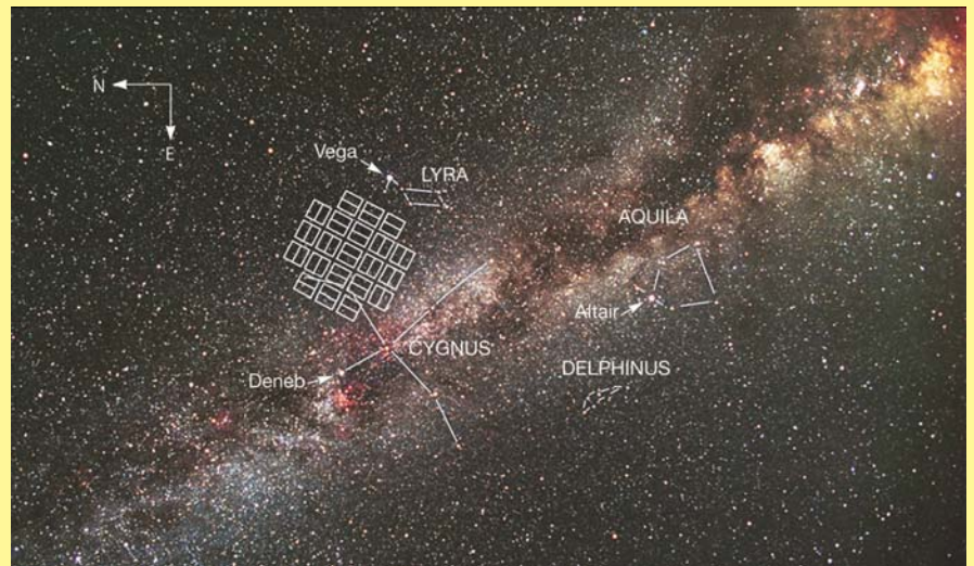
Кеплер будет исследовать звезды в направлении спирального рукава Ориона нашей Галактики. Расстояния до большинства исследуемых звезд, около которых будет осуществляться поиск землеподобных планет, находятся в промежутке от 600 до 3000 световых лет. Свечение звезд, находящихся дальше 3000 световых лет, является слишком слабым для обнаружения транзитов планет (илл. NASA)

Поиск пригодных для жизни планет — не просто прихоть астрономов. По оценкам ООН, до 2050 г. на нашей планете могут исчерпаться запасы нефти, газа и урана, будет не хватать продовольствия, а естественные условия могут стать непригодными для жизни, поэтому альтернативная «Земля» человечеству не помешает. И пускай даже сейчас это считается слишком смелым, если не смешным, заявлением, никто не сможет спрогнозировать, как на него будут реагировать через 100-200 лет.