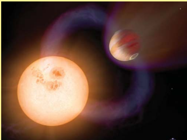
SWEEPS-10 в представлении художника

Но зато уже планета SWEEPS-10 — самая быстрая из всех обнаруженных землянами — год на ней (полное вращение вокруг звезды SWEEPS J175902.00-291323.7) равен всего лишь десяти земным часам. В этом случае планета находится на чрезвычайно близком расстоянии от своей звезды — 1,2 млн. километров, что лишь втрое превышает расстояние от Земли до Луны. Для того чтобы не быть поглощенной звездой SWEEPS-10 должна быть чрезвычайно массивной — и действительно, масса газового гиганта в 1,6 раза выше массы Юпитера, самой тяжелой планеты Солнечной системы. Кроме того, эта планета еще и одна из самых горячих из всех обнаруженных — температура на ее поверхности составляет около 1650°C