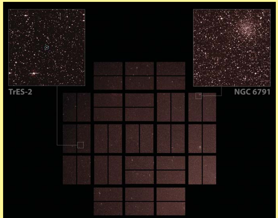
Орбитальный телескоп «Кеплер» (Kepler) сделал первые снимки региона пространства, за которым ему предстоит наблюдать последующие 3,5 года. Об этом сообщается в пресс-релизе, опубликованном на сайте NASA. Вы видите эти фотографии. На изображении в центре виден весь регион наблюдения, размер которого составляет 100 квадратных градусов. Данный регион содержит примерно 4,5 миллиона звезд, за 100 тысячами из которых «Кеплер» будет вести непрерывное наблюдение.

Квадратиками выделено: рассеянное скопление NGC 6791 возрастом в 8 миллиардов лет, расположенное на расстоянии примерно 13 000 световых лет, и затменная система TrES-2, удаленная на 718 световых лет.