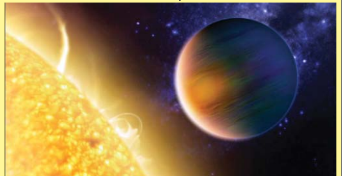
WASP-17b в представлении художника