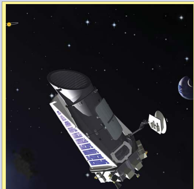
Космический телескоп Kepler