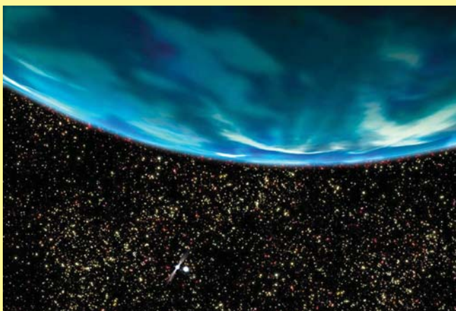
PSR B1620-26 b в представлении художника

Это полная противоположность предыдущей экзопланете. Ее возраст оценивается в 13 млрд. лет, то есть, почти втрое старше Земли. Интересно и то, что PSR B1620-26 b является частью двойной звездной системы, в которой одна из звезд является белым карликом, а вторая — быстро вращающимся пульсаром (делает около 100 оборотов в секунду вокруг своей оси).