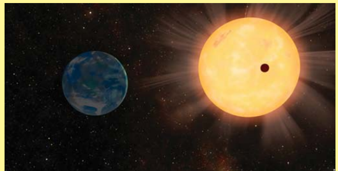
GLIESE 581c в представлении художника

Год на Gliese 581c составляет 13 земных дней. Планета удалена от звезды на расстояние около 11 млн. км, что в 13 раз меньше, чем Земля (при этом Gliese 581 втрое меньше Солнца). Наконец, эта планета находится в пределах «обитаемой зоны» (т.е. области в космосе, где существуют благоприятные для зарождения жизни условия). Развитие космической науки могло бы, безусловно, помочь в исследовании этой чрезвычайно любопытной планеты.