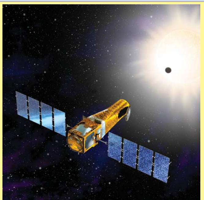
Космический телескоп COROT