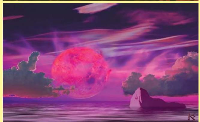
Планету GLIESE 581c художники часто изображают обитаемой с обилием воды