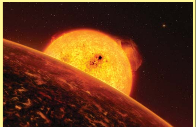
COROT-7b в представлении художника

Небесное тело HD156688b в четыре раза тяжелее Земли, удалено от нее на расстояние около 80 световых лет и обращается вокруг звезды в направлении созвездия Геркулеса. Планета совершает один оборот вокруг звезды за четыре дня.