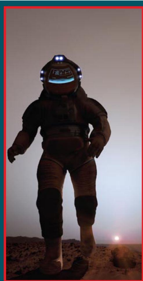
Скафандр для прогулок по Марсу

Самому полету будут предшествовать многочисленные автоматические экспедиции. Космонавтам на Марсе может понадобиться немало различного оборудования и припасов. Необходимо подготовить и помещения, в которых можно спрятаться от облучения. Раньше предполагалось,