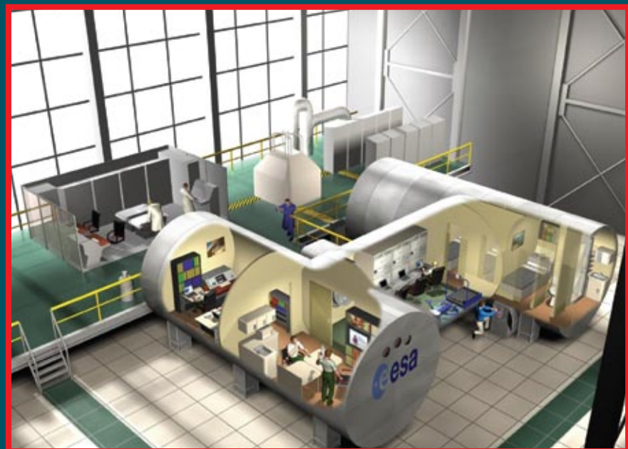
Проект «Марс-500» — ключевой этап в психологической подготовке астронавтов, которые будут длительное время находиться друг с другом в замкнутом пространстве

«База на Луне представляет собой несомненную ценность. Это ближайшее к нам космическое тело, и организовать