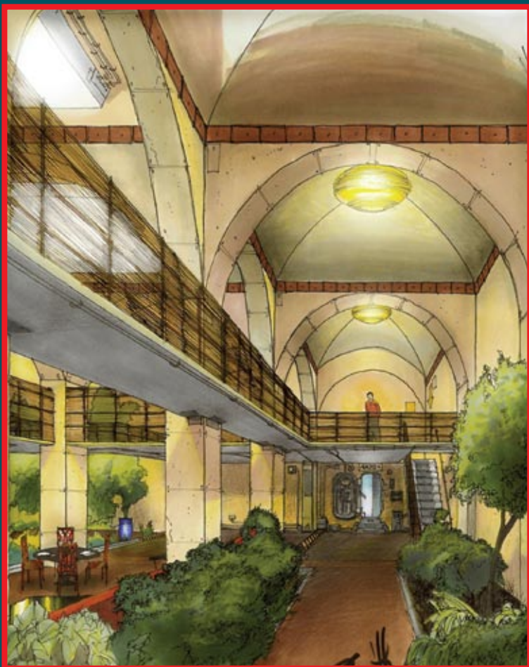
Улицы марсианского города