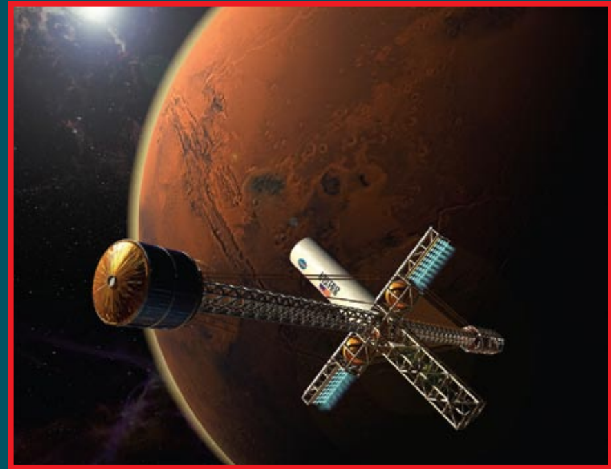
Марсианский пилотируемый корабль «разработки» 2003 года

Облучение в открытом космосе бывает двух типов. Во-первых, электромагнитное излучение Солнца в рентгеновском и гамма-диапазонах. От него защищает толстая металлическая обшивка корабля. Во-вторых, быстрые тяжелые частицы: протоны, нейтроны, ядра гелия и других элементов. У этих частиц есть два источника — солнечный ветер и галактические космические лучи. Интенсивность первых больше, зато у вторых значительно выше энергия. При попадании в обшивку корабля быстрые частицы тормозятся, и не только возникает жесткое излучение, но и может пройти ядерная реакция, которая приводит к радиоактивному заражению обшивки. Кроме того, попадание быстрого тяжелого ядра из состава космических лучей в живую клетку чревато для нее повреждением молекулы ДНК, а по разным оценкам за время полета тяжелые ядра поразят от