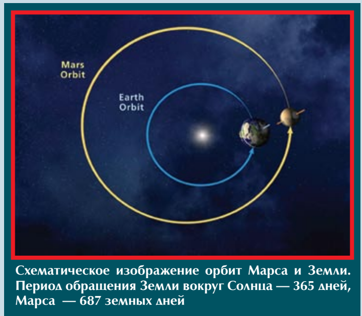
Схематическое изображение орбит Марса и Земли. Период обращения Земли вокруг Солнца — 365 дней, Марса — 687 земных дней

Как видим, аргументация сторон серьезная, и принять пра-