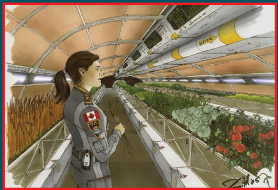
Оранжерея по выращиванию овощей на той же базе (Mars Foundation)

Стругацкими Венера, на Марсе дышать совсем нечем и расстояние выхода ограничено запасом кислорода в баллоне. А скафандр едва ли позволит свободно орудовать пальцами и разглядывать все, что хочется. В любом случае прогулки американских астронавтов по значительно более удобной Луне выглядели именно как прогулки, никаких особых открытий им там сделать не удалось.