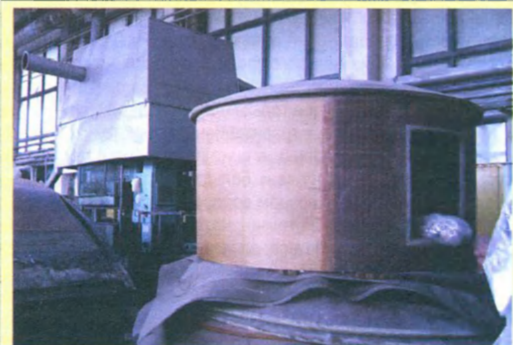
...но что-то и делается, и очень неплохого качества