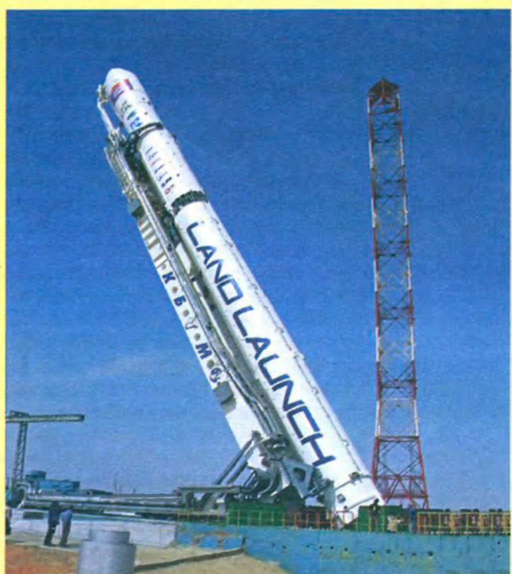
Ракета-носитель «Зенит-3SLB». Подготовка к пуску со стартовой площадки космодрома Байконур

гласно КОСМОТРАС, ни одна другая компания-оператор запуска в мире не может предложить заказчику такой вид сервиса.