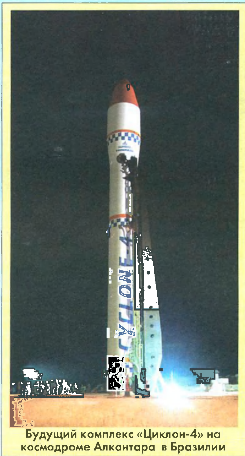
Будущий комплекс «Циклон-4» на космодроме Алкантара в Бразилии

Новое ОКБ (от Миавиапрома) было создано в ХАИ сразу после войны, в 1946 г. По данным «Независимого военного обозрения», оно находилось в постоянной конкуренции с Днепропетровской реактивной группой, занимавшейся аналогичными задачами, и через 2 года было ликвидировано «... в связи с необходимостью сосредоточить работающих в области создания реактивных двигателей в более крупных организациях». Но в 1951 г. за дело в Харькове принялись по-серьезному — новому заводу «Электроинструмент» (затем «Коммунар», или №897) поручалось поставлять Днепропетровскому заводу № 586 бортовую аппаратуру системы управления (СУ) для производимых этим предприятием ракет Р-1, Р-2, Р-5. Аппаратура выпускалась по документации московского НИИ-885. В составе завода было образовано СКБ во главе с директором завода. В 1959 году на