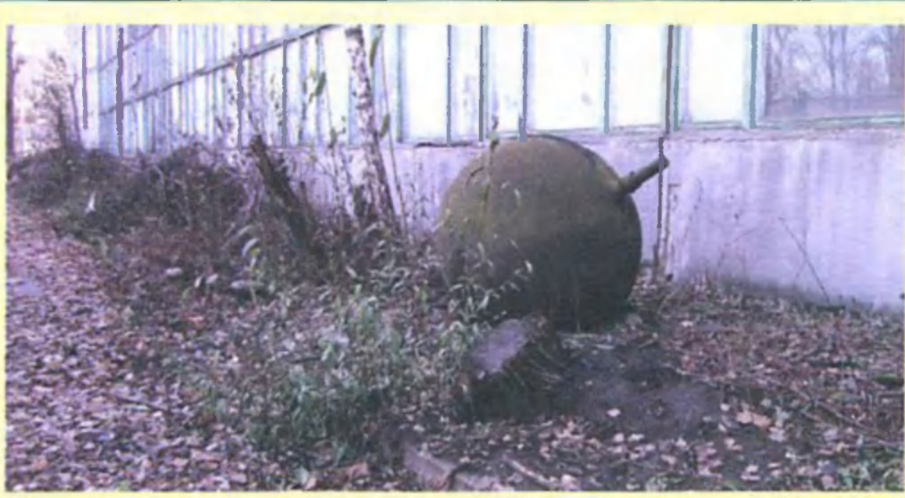
Типичный ландшафт у стен НПО «Сатурн», «Квант» и др., территория любого НИИ и НПО — до сих пор «музей под небом»...

На протяжении более 50 лет главным партнером КБ «Южное» является производственное объединение «Южный машиностроительный завод». Работа этого тандема до сих пор дает возможность быстро и качественно осуществлять полный комплекс работ, от первичной конструкторской разработки до выпуска серийной продукции. По данным пресс-службы КБ и НКАУ, за период деятельности системы КБ «Южное»/ПО «Южмаш» создано 13 боевых ракетных комплексов, 7 космических ракетных комплексов, более 70 типов космических аппаратов, около 50 типов ракетных двигателей и двигательных установок различного назначения, свыше 150 новых материалов и технологий. Результатом совместной работы стало осуществление более 900 пусков ракет-носителей космического назначения, вывод на орбиты более 400 спутников в интересах астрофизических наблюдений, глобальных исследований, дистанционного зондирования Земли и Мирового океана, а также задач национальной обороны. КБ «Южное» — единственная компания в мире, которой принадлежат три семейства (пять типов) ракет-носителей, находящиеся в эксплуатации: «Циклон-2», «Циклон-3», «Днепр», «Зенит-2» и «Зенит-3SL».