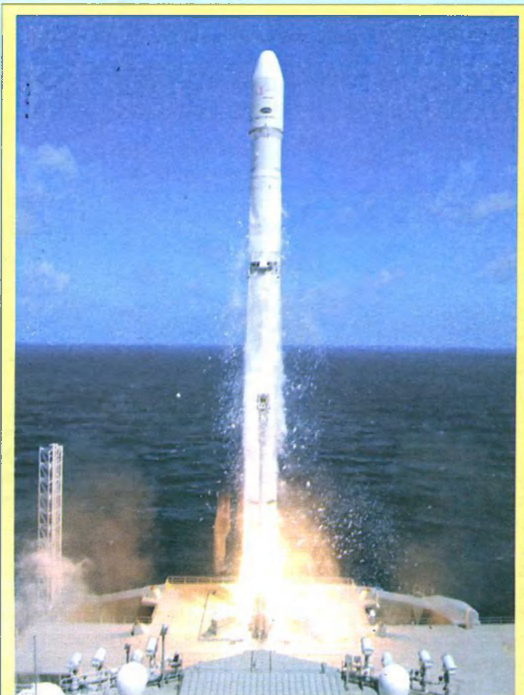
Старт ракеты-носителя «Зенит-3SL» с экватора в Тихом океане

Это, по экспертным оценкам, наиболее удачная конверсионная разработка постсоветской космонавтики — российско-украинский проект, разрабатываемый с 1992 года. Она создана на базе знаменитой РС-20 (SS-18 «Сатана»), боевой ресурс которой не исчерпан и до сих пор пугает даже американцев (спасая нас от участи сербов или иракцев). По договору СНВ-1, половина всех этих ракет должна была быть уничтожена. Но в 90-х власти Украины и России приняли удачное решение, и 150 ракет вместо ликвидации стали заготовками для превращения в ракету-носитель. Как и SS-18 «Сатана», она обладает высокими энергетическими возможностями и надежностью. Ракета имеет стартовую массу 211 т, длину 34 м, диаметр 3 м и способна вывести на орбиту высотой 300-900 км космический аппарат или группу спутников различного назначения стартовой массой до 3,7 т. Один запуск «Днепра» стоит около €18 млн. Ракета стартует из шахтной пуско-