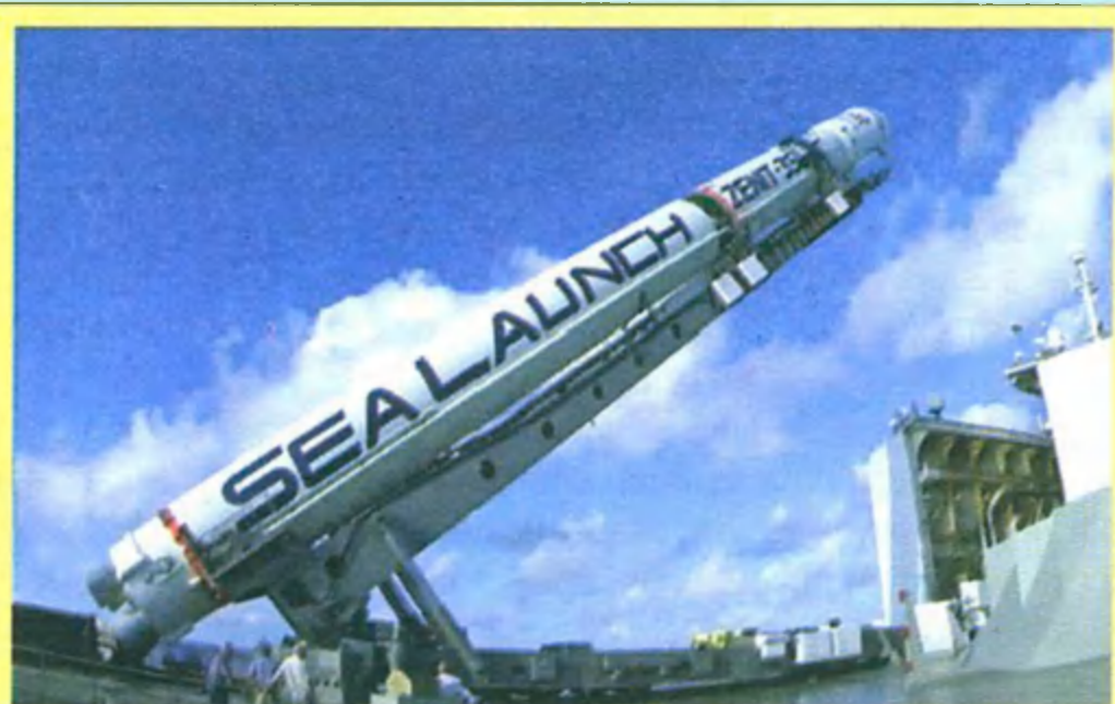
Установка ракеты-носителя Зенит-3SL на стартовую платформу «Одиссей»

матривает совместное выполнение научных космических исследований и прикладных программ, совместное создание микроспутников дистанционного зондирования Земли и полезной нагрузки для них (оптико-электронной и спектральной аппаратуры), систем управления, разработку современных технологий обработки данных. Среди совместных проектов, в частности, — использование информации от украинского и белорусского спутников «Сич-2» и «БелКА-2» после их запусков на околоземную орбиту.