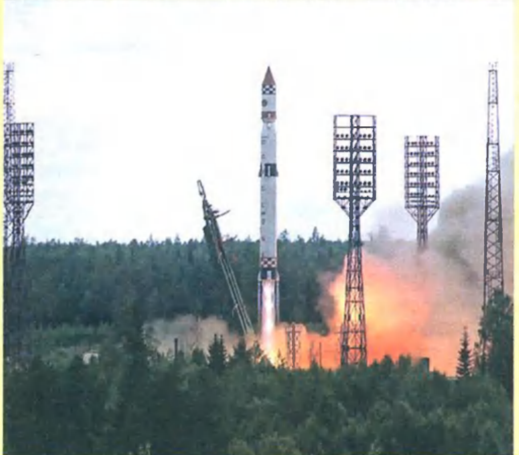
31.07.2001 Ракета-носитель «Циклон-3» вывела на орбиту КА «АУОС-СМ-КФ», предназначенный для исследования Солнца

запуск спутников западных или крупных некосмических стран. Услугами «Зенита» пользуются владельцы спутников США (спутники Telstar, Rock и др.), Израиля (AMOS), Малайзии (Messat), Египта, Саударавии и др. Уже к 2001 было сделано 5 запусков, в дальнейшем происходило по несколько запусков ежегодно. Со временем программа морских стартов была дополнена программой запусков с космодромов — «Наземный старт». К 2008 г. местом для нее стал казахстанский Байконур, а первыми спутниками наземного запуска — израильские AMOSы.