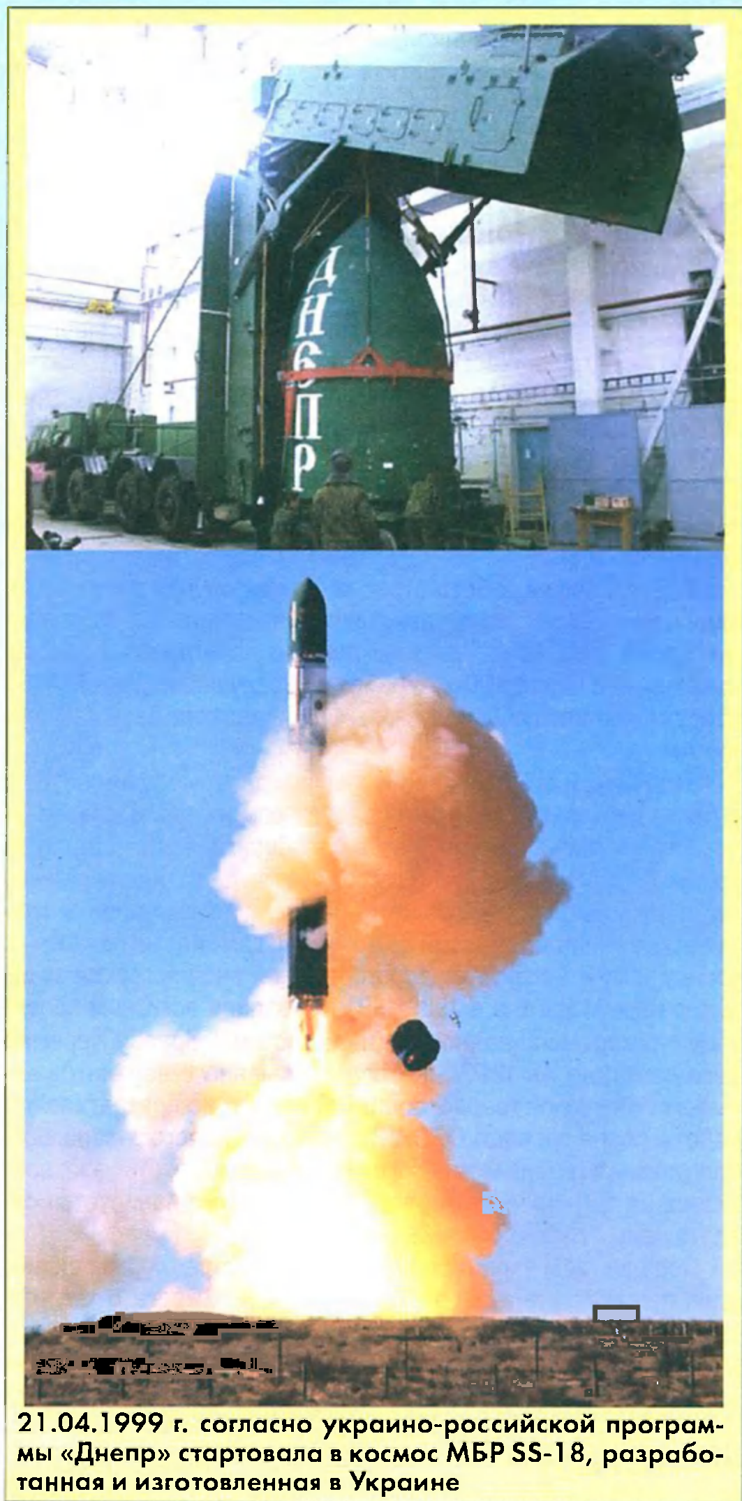
21.04.1999 г. согласно украинско-российской программы «Днепр» стартовала в космос МБР SS-18, разработанная и изготовленная в Украине

В СНГ Украина начала взаимодействие с Беларусью, решившей до 2012 г. создать свое космическое агентство. Подписанный в Минске главой НКАУ и председателем президиума Национальной академии наук Белоруссии документ предус-