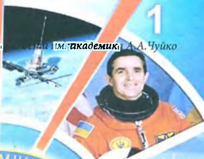
им. академик А.А. Чуйко