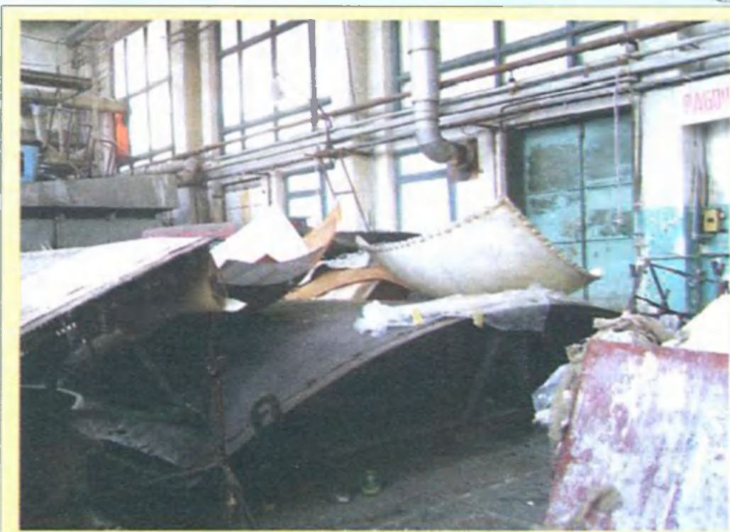
В цехах застыла перестройка...

К сожалению, такие оазисы встречаются все реже, и к тому же они часто отрываются от связи с современным производством. Которое осуществляется в тех самых, полуразваленных замусоренных цехах, теми самими (хотя и постаревшими) специалистами, в помощниках которых периодически заметны молодые сыновья или родственники. Отрасль выручают именно эти «советские» кадры — сотрудники пенсионного возраста и последние поколения советских еще инженеров (которым уже по 50-70 лет). Уникальный и сверхдешевый ручной труд заменяет все новейшие автоматы и роботы, превращая, как и ранее, детали и компоненты в лучшее в мире изделие. Запад, со всеми его технологиями и деньгами, пока так и не смог пересилить наш производственный потенциал даже в его нынешнем, на 90% разваленном, виде. Возможно, именно в этом и заключается тайна понятий «русская/украинская душа» и «советский характер».