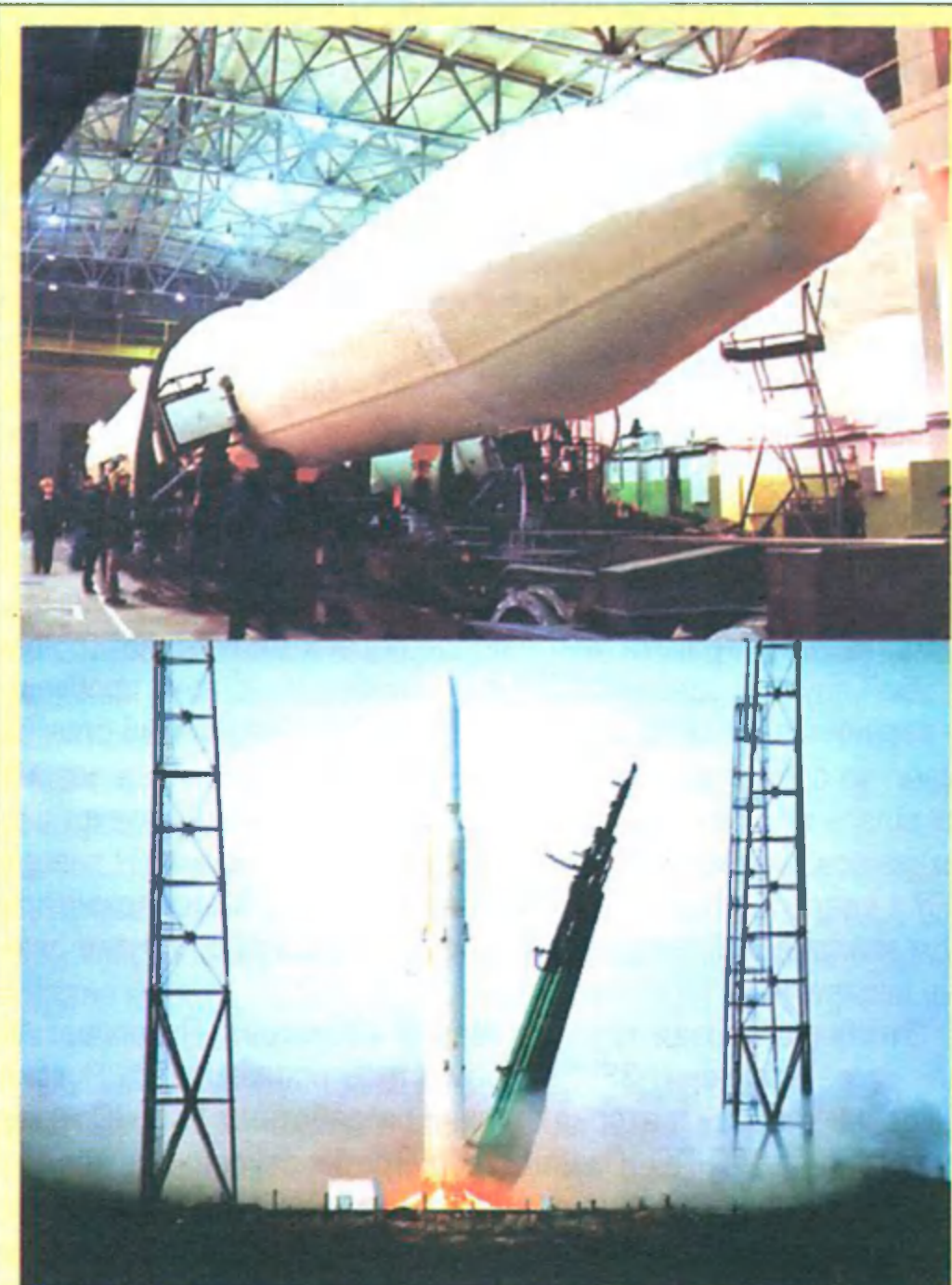
РН «Циклон-2» на космодроме Байконур

Соответственно, данные РН ориентированы в основном на