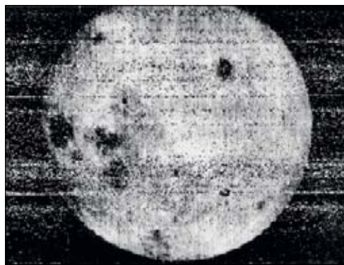
Первая фотография обратной стороны Луны, полученная космическим аппаратом «Луна-3» 7 октября 1959 года.

Здесь мы употребили термин «фотография» как образ элемента множества «не строгих истин». Но в истории науки есть пример «настоящей фотографии», которая относится к этому множеству. Это — первая фотография обратной стороны Луны.