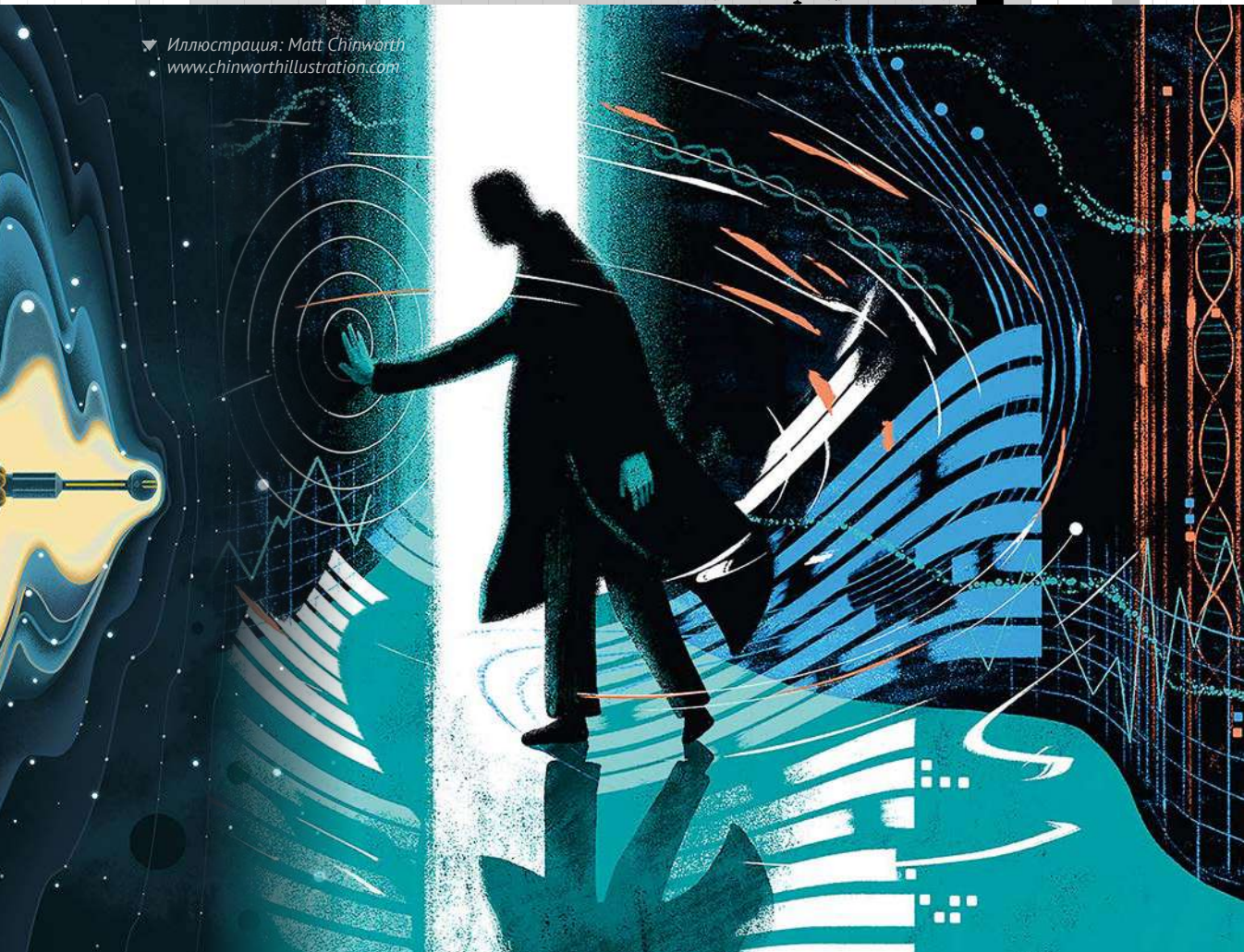
Иллюстрация: Matt Chinworth www.chinworthillustration.com

Похоже, в моем случае нервное напряжение оказалось тем непредсказуемым фактором, что изменил мою массу, и я впился в пространство-время не полностью – вроде бы я здесь, но вроде меня и нет. Испытывая новое потрясение, я вновь меняю массу и прыгаю все дальше. Что нужно сделать, чтобы вернуть первоначальное состояние: совсем успокоиться, умереть? А может, наоборот, подвергнуться такому жестокому стрессу, чтобы меня