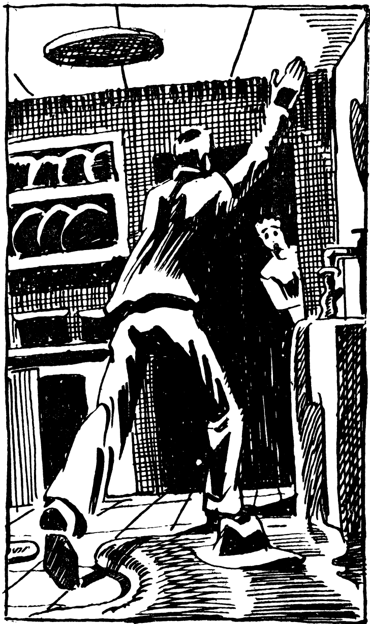
Рисунки В. КОЛТУНОВА