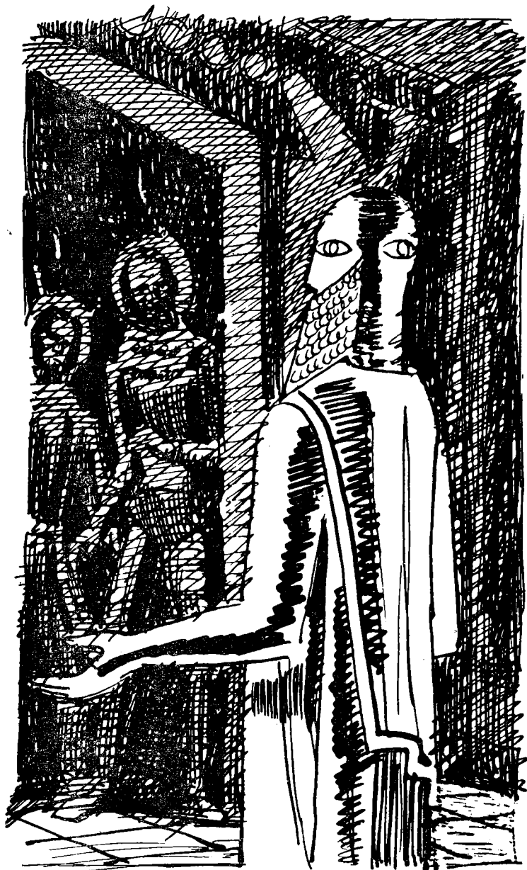
Рисунки В. КОЛТУНОВА