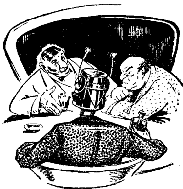
Рисунки ОЛЕСИ МАКАРОВОЙ

— Он в наших руках, этот огрызок урана от старой космической клячи Хека!