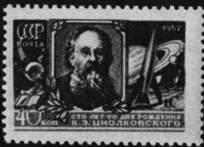
Konstantin Ziolkowski, der Begründer der Raketentheorie und -technik

Eine sowjetische Rakete brachte im September 1959 einen sowjetischen Wimpel auf die Mondoberfläche