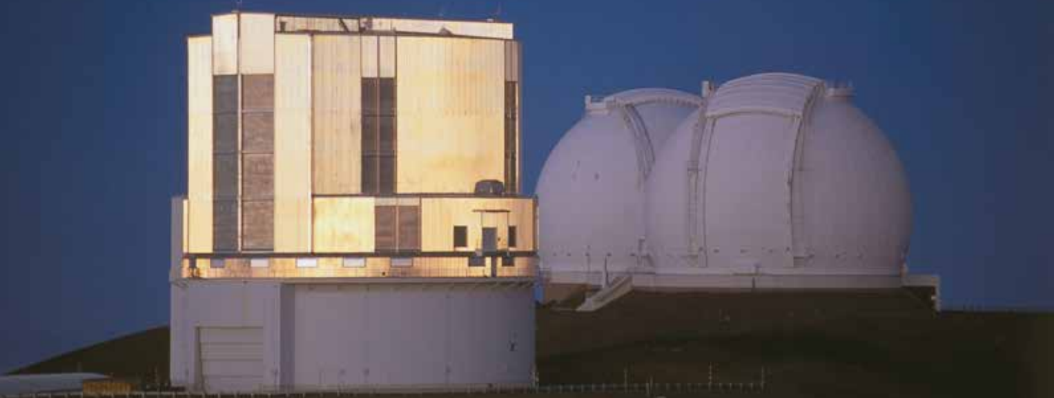
JСMT (James Clerk Maxwell Telescope) — крупнейший астрономический телескоп (диаметр зеркала 15 м), построенный специально для субмиллиметрового диапазона, от сотен микрометров до миллиметра. Расположен на Гавайях на высоте 4092 м

Р-Н фосфина ( \text{PH}_3 ). Если вы помните, колебания атомов в молекуле могут сопровождаться изменением длин связей, углов между связями либо вращением вокруг связей. Обычно им соответствуют полосы поглощения в ИК-спектрах. Эти колебания имеют более высокую энергию, чем вращение вокруг одинарной связи малых по объему фрагментов молекулы. В случае \text{PH}_3 колеблется и вращается самый малый из возможных объектов — атом водорода, поэтому энергия этих полос мала. Энергия его вращательной полосы вообще выходит за пределы ИК-спектрального диапазона и лежит в более длинноволновом миллиметровом диапазоне 1,123 мм (266,94 ГГц). Оно и хорошо, поскольку атмосфера Венеры в ИК-диапазоне «забита» полосами поглощения \text{CO}_2 (потому он и «парниковый» газ), и обнаружить слабые сигналы фосфина на планетарных расстояниях вне этого диапазона несколько легче.