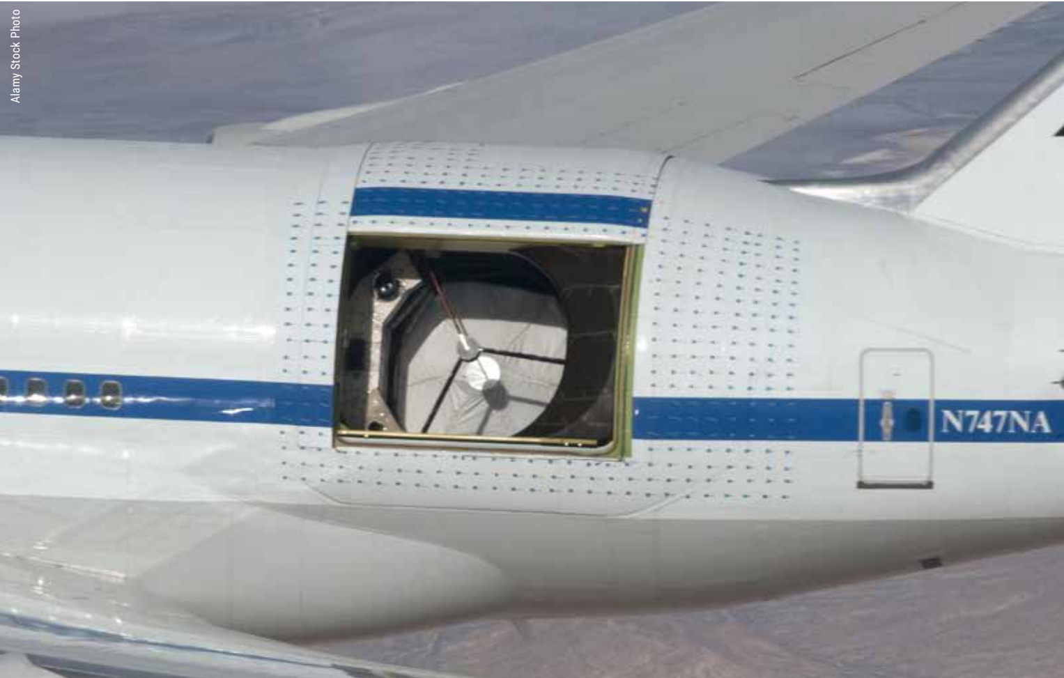
SOFIA (Stratospheric Observatory for Infrared Astronomy) в полете с открытой телескопной дверью. Самолет с телескопом поднимается на высоту 12—14 км и позволяет сделать качество получаемой «картинки» близкой на уровне космических обсерваторий