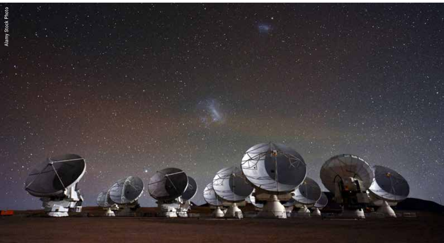
ALMA (Atacama Large Millimeter/submillimeter Array) — Атакамская большая антенная решётка миллиметрового диапазона — комплекс из 66 радиотелескопов, расположенных в чилийской пустыне Атакама на высоте 5 км