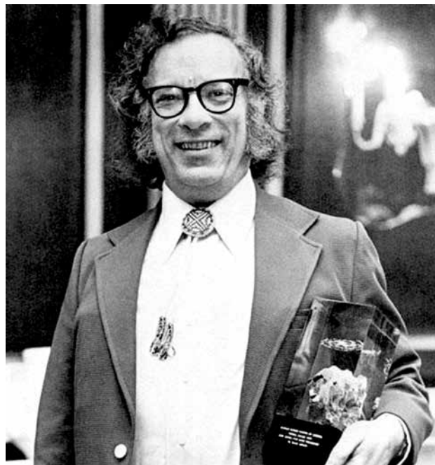
Айзек Азимов с наградой Невьюла (туманность), одной из самых престижных премий в фантастике

Начиная с конца 1960-х годов и до самой смерти писателя, да и после его смерти, на Азимова начали сыпаться всевозможные литературные награды, он не раз становился