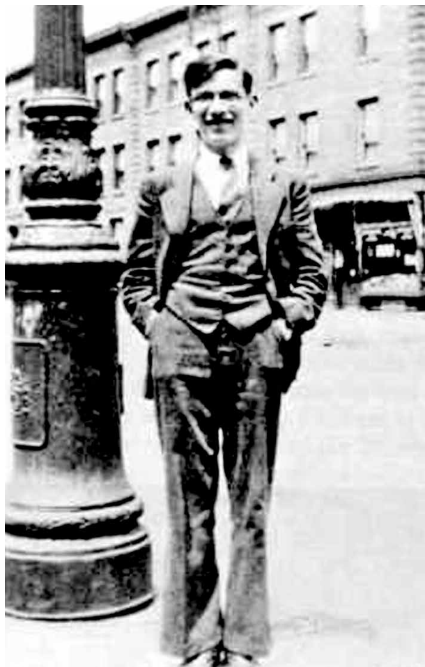
Айзек в 1934 году, в возрасте четырнадцати лет, около кондитерской, принадлежащей семье Азимовых.

Айзек обожал школу и любил учиться. Его ненавидели одноклассники и учителя, потому что Айзек не стеснялся показывать, что он умнее первых и постоянно поправлял вторых и спорил с ними. Азимов мало интересовался подвижными играми, он был слишком тощий и слабый для спорта, к тому же близорукий. Его близорукость проявилась, когда он учился в средней школе, и ему выписали очки, которые будущий писатель носил с тех пор до конца жизни. Для него это было естественно — отец носил очки, и мать тоже, в конце концов, даже его младшие сестра и брат со временем тоже стали носить очки.