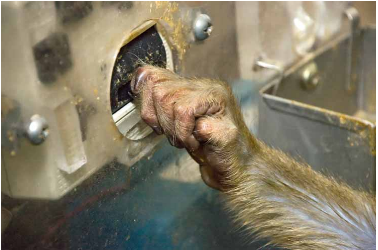
Джойстик имеет размеры, соответствующие лапке макаки

Обезьяны не только привыкают к виду компьютерных систем, но и при первой же возможности стараются исследовать новую «игрушку»