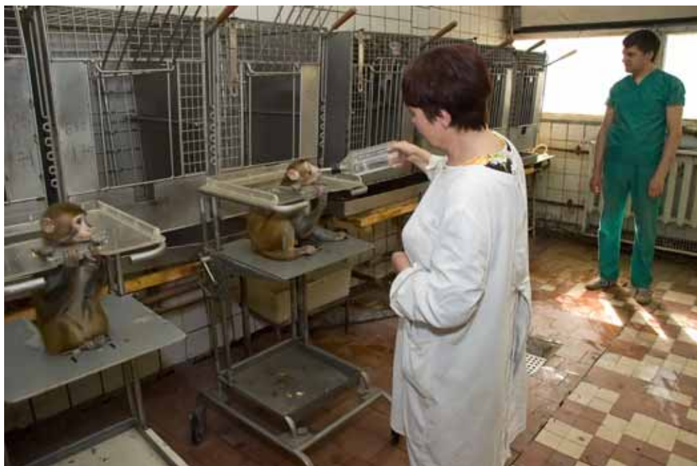
Сотрудники время от времени предлагают своим питомцам попить воды, так как самостоятельно обезьяны сделать этого не могут

две группы по 10–15 обезьян. Одна группа – контрольная. Схема экспериментального радиационного воздействия имитирует реальное облучение космонавта при полете к Марсу и включает в себя острую и хроническую фазы. В качестве источника радиоактивного излучения используют радиоактивный изотоп цезия – Cs^{137} . Облучению обезьяны подвергаются постоянно, так же, как и будущие космонавты на борту корабля, летящего к Марсу.