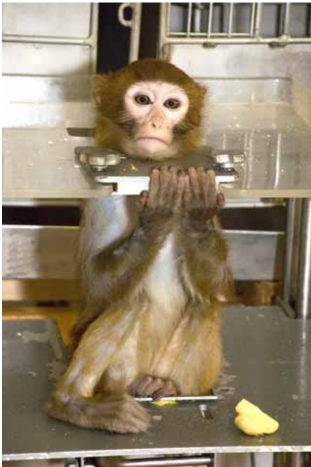
Почему необходимо держать обезьян в приматологических креслах? Именно так имитируется гипокинезия, неизбежная при длительных межпланетных перелетах. Однако приматологическое кресло не фиксирует обезьяну намертво – оно только лишает макаку возможности совершать активные движения, вынуждая ее находиться примерно в одном положении

Обезьяны не только привыкают к виду компьютерных систем, но и при первой же возможности стараются исследовать новую «игрушку»