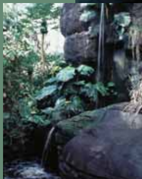
Кусочек тропического леса