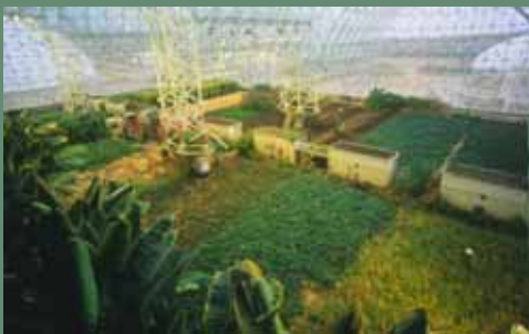
Сельскохозяйственные угодья в «Биосфере-2»