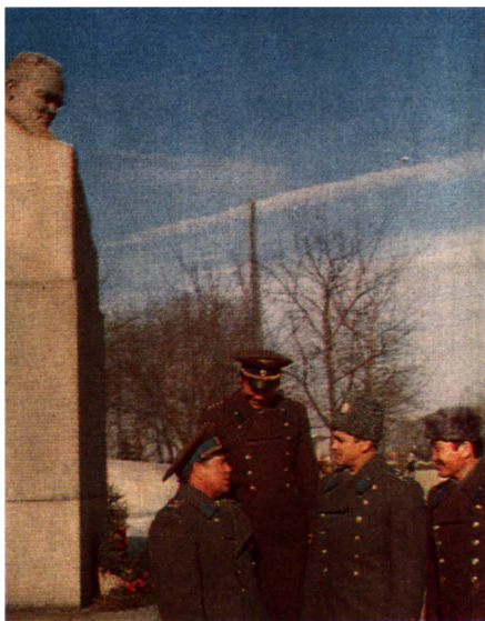
У памятника С. П. Королеву