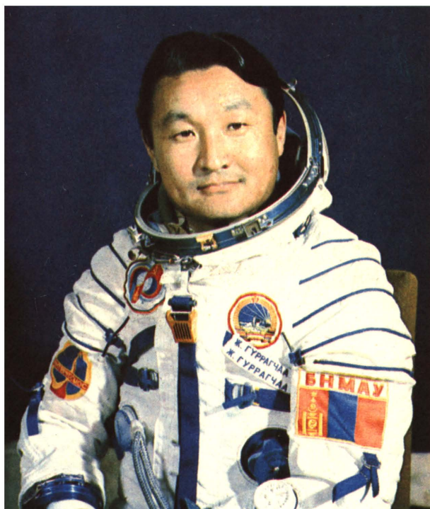
Космонавт-исследователь ЖУГДЭРДЭМИДИЙН ГУРРАГЧА