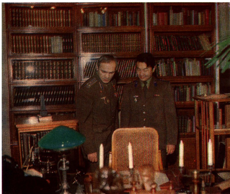
В Музее-квартире В. И. Ленина в Кремле