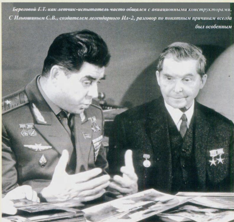
Береговой Г.Т. как летчик-испытатель часто общался с авиационными конструкторами. С Ильюшиным С.В., создателем легендарного Ил-2, разговор по понятным причинам всегда был особенным

Было у летчика-штурмовика Берегового заветное правило: «Не будешь думать, собьют!». Этому учил он и своих подопечных. И слово не расходилось с делом. На Ил-2 с бортовым номером «22» Георгий ни разу не был сбит. В октябре 1944 года за мужество