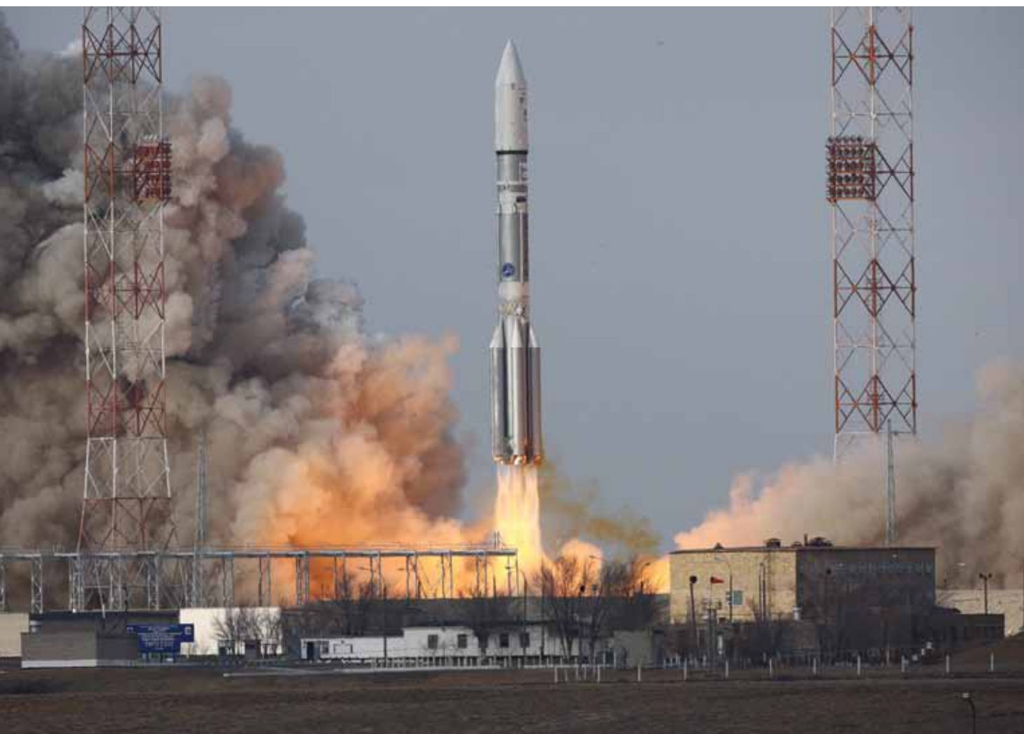
Запуск ракеты-носителя «Протон-М» с двигателями первой ступени производства ОАО «Протон-ПМ»

— Наверное, ракетные двигатели скоро будут делать исключи-