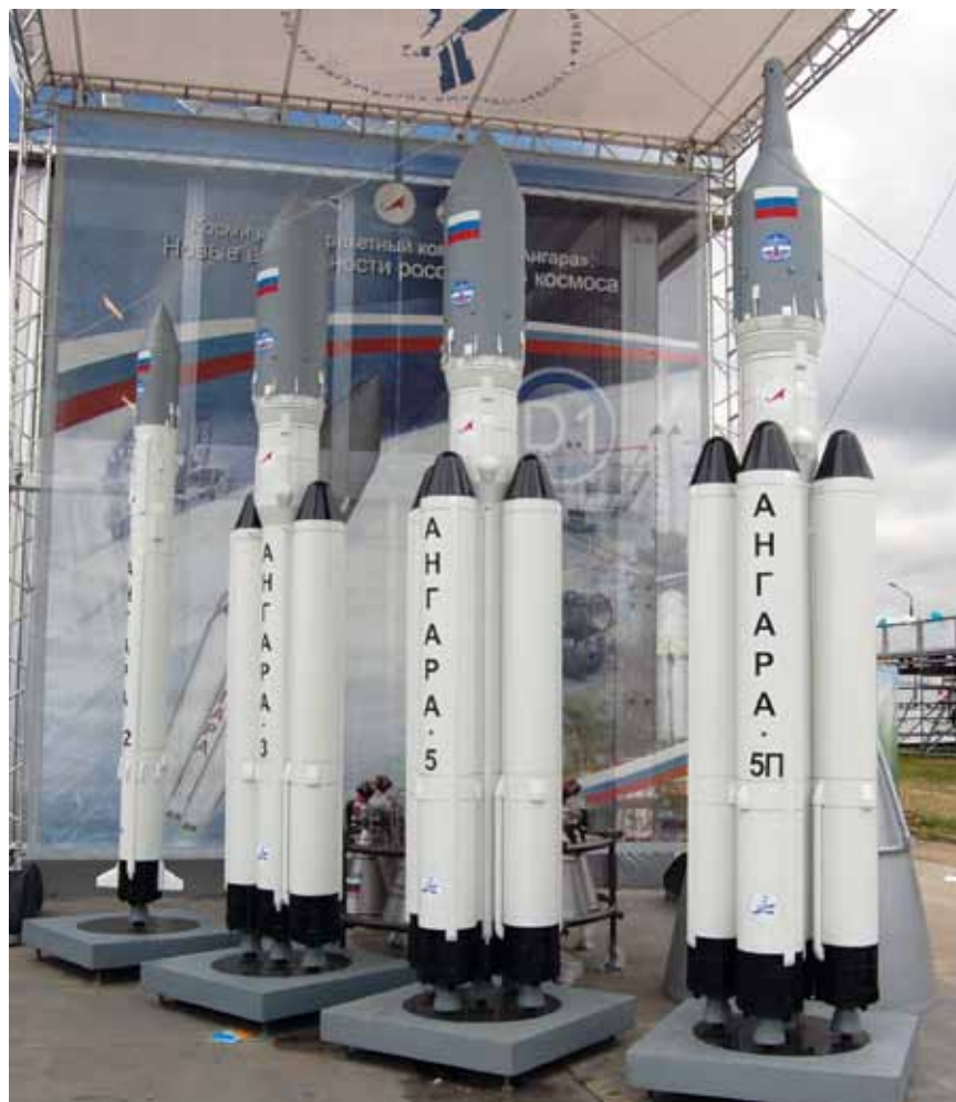
Макеты семейства перспективных ракет-носителей «Ангара» (Международный авиационно-космический салон «МАКС», август 2009 года).

— На предприятии у меня работало большинство родственников, отец. Жили мы в микрорайоне, где практически все были связаны с моторостроительным заводом. И окружение, и школа формировали понимание, что другого жизненного пути быть не может. Но мне особенно повезло. После окончания Пермского политехнического института я сразу попал на производство ракетных двигателей. Работа на закрытом