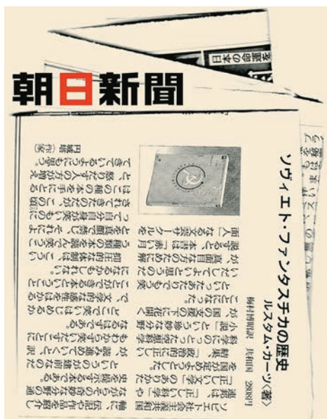
Рецензия в газете "Асахи"