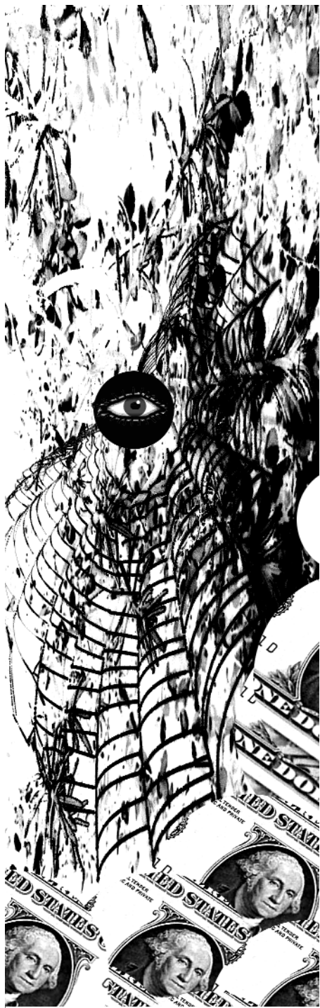
Окончание. Начало в № 4.

— Чего боюсь? И нет смятения в груди... Но ждет убийство впереди.