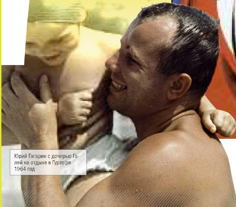
Юрий Гагарин с дочерью Галей на отдыхе в Гурзуфе. 1964 год

ФЕКТ Смерть первого космонавта стала большим потрясением для страны, а результаты официального расследования засекретили почти на полвека, потому и появилось множество конспирологических версий. На самом деле СССР так и не отправил к Луне ни одного космонавта. А Юрий Гагарин погиб в авиакатастрофе (в ходе тренировочного полета на МиГ-15 УТИ) 27 марта 1968 года во Владимирской области, чему есть немало свидетелей; найденные останки опознали коллеги космонавта.