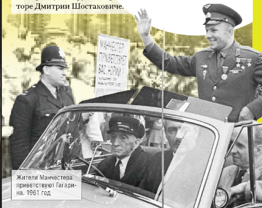
Жители Манчестера приветствуют Гагарина. 1961 год