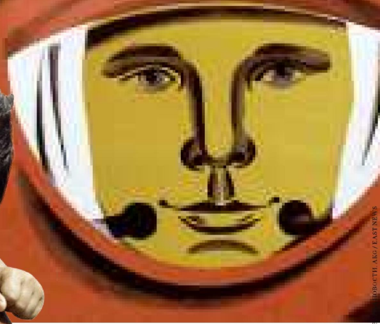
Юрий Гагарин. Плакат 1971 года