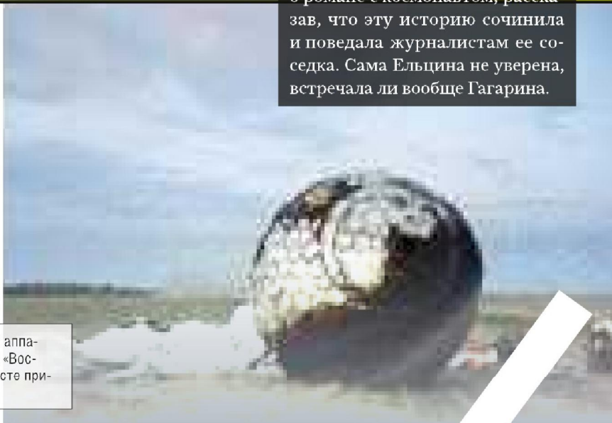
Спускаемый аппарат корабля «Восток-1» на месте приземления

НЕТ Анастасия Гирина, впоследствии Наина Ельцина, и Юрий Гагарин могли бы познакомиться в 1955–1956 годах, когда он был курсантом летного училища в Оренбурге (в то время называвшемся Чкалов), а она работала в этом городе после института. Однако вдова первого президента России в интервью газете «Московский комсомолец» в 2012 году развеяла миф о романе с космонавтом, рассказав, что эту историю сочинила и поведала журналистам ее соседка. Сама Ельцина не уверена, встречала ли вообще Гагарина.