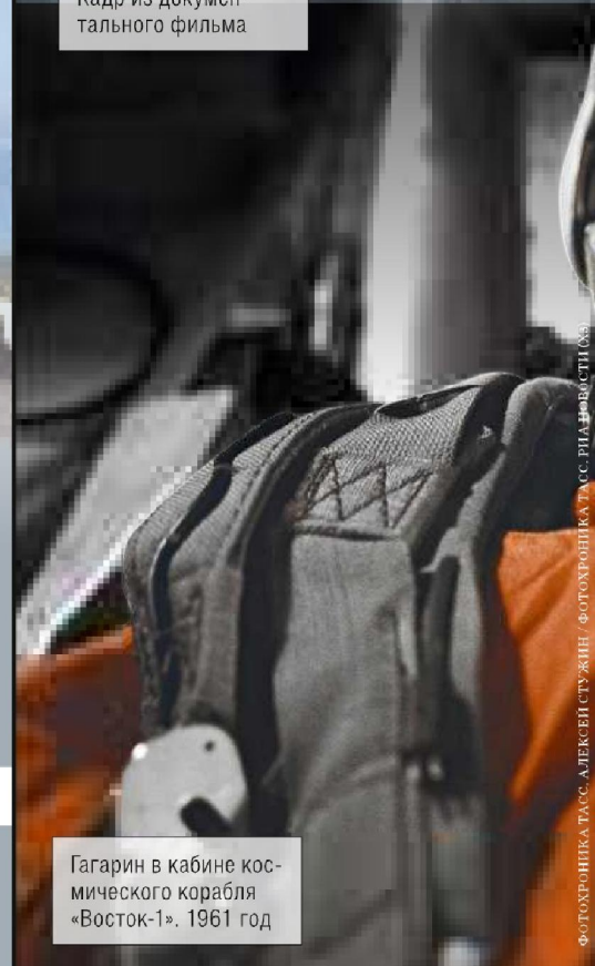
Гагарин в кабине космического корабля «Восток-1». 1961 год