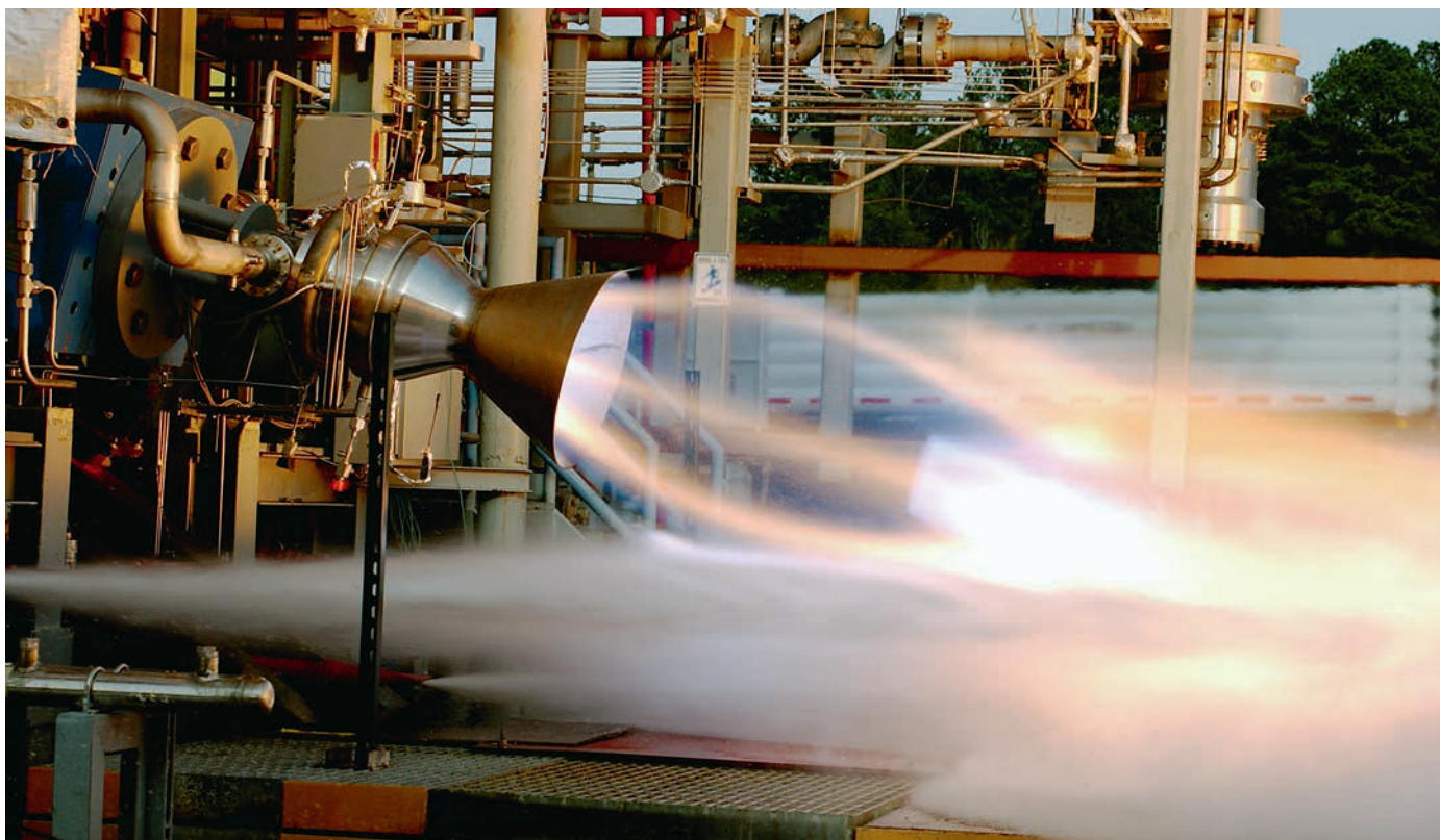
Американский двигатель RS-88 на этаноле и жидком кислороде