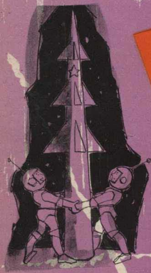
Елка у космонавтов. Рисунок Г. Иоровина.