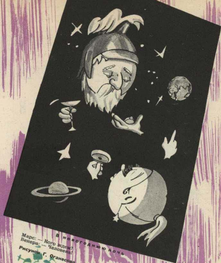
В новогоднюю ночь Маре — Ного ядём! Венера — Человечка! Рисунок Г. Фганесова.