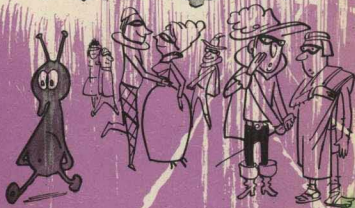
— Тебе не кажется, что это настоящий марсианин? Рисунок Р. Овняина.