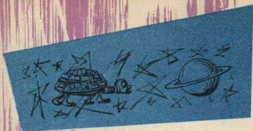
— Далека ты, путь-дорога! Рисунок Р. Коняшова.