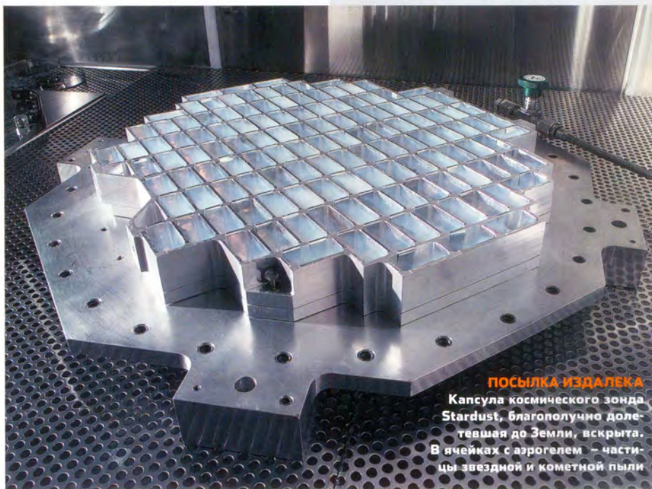
ПОСЫЛКА ИЗДАЛЕКА Капсула космического зонда Stardust, благополучно долетевшая до Земли, вскрыта. В ячейках с аэрогелем – частицы звездной и кометной пыли

Результаты анализа пыли, собранной зондом Stardust, произвели в научном мире сенсацию. В пыли кометы, которая, как считалось, формировалась на окраинах Солнечной системы, в поясе Койпера за орбитой Плутона, при очень низких температурах, ученые обнаружили частицы минералов оливина, пироксена и шпинели. Их образование возможно только при температурах выше 1000°C. А это значит, что частицы каким-то образом попали в пояс Койпера из области, близкой к Солнцу или к другой звезде! Теория "магнитоэлектрического конвейера", основанная на работах Фрэнка Шу из Калифорнийского университета в Беркли, объясняет этот факт так: некоторые частицы из областей, близких к молодому Солнцу, выбрасывались во внешние области благодаря взаимодействию между магнитными полями вращающегося пылевого диска и самой звезды. "Эти данные говорят о том, что, возможно, протопланетный пылевой диск не был спокойным местом, – говорит Скотт Сэнфорд из исследовательского центра NASA им. Эймса. – У нашей планетной системы могло быть бурное прошлое".