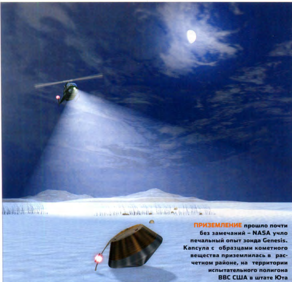
ПРИЗЕМЛЕНИЕ прошло почти без замечаний – NASA учло печальный опыт зонда Genesis. Капсула с образцами кометного вещества приземлилась в расчетном районе, на территории испытательного полигона ВВС США в штате Юта

в 200 больше собственного размера, тормозится и останавливается.