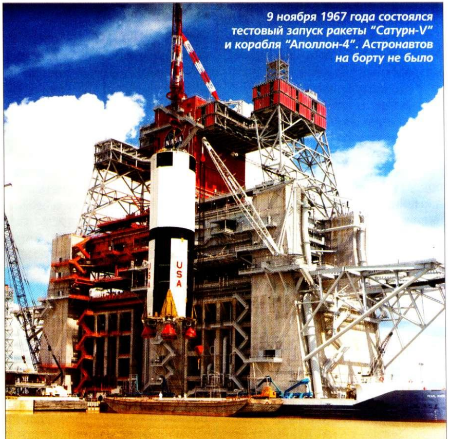
9 ноября 1967 года состоялся тестовый запуск ракеты "Сатурн-V" и корабля "Аполлон-4". Астронавтов на борту не было