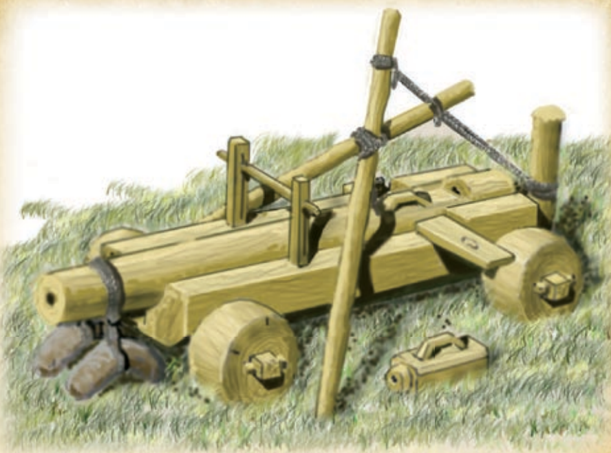
Деревянная пушка со съемной зарядной камерой и простейшим противоткатным устройством

Но... в партии Хидээри нашлись и другие советчики, и как бы это ни казалось странным, но мнение испуганной женщины и двух братьев Оно и Ода вопреки очевидности возобладало над здравым смыслом. Мирные предложения Иэясу были обсуждены, приняты и подписаны, причем сам он расписался на них кровью из кончика своего пальца. Всем ронинам, воевавшим на стороне Хидээри, давалось полное прощение, а сам Хидээри получил свободу выбора места жительства по своему усмотрению в обмен на клятву не поднимать восстания против Иэясу. Самое важное из условий, хотя Токугава и его представители упоминали о нем, по крайней мере, три раза, касалось засыпки внешнего, самого глубокого рва, который теперь был вроде бы как уже и не нужен. Но хотя Иэясу и говорил об этом, в окончательный вариант договора этот пункт почему-то включен так и не был, хотя осакская сторона его и признала.