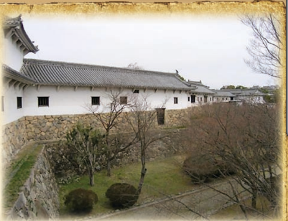
Стена с внутренней стороны. Вдоль стены - длинная узкая галерея, по которой могли ходить обороняющиеся

Тогда Иэясу приказал окружить замок защитным валом, поставить частокол и приступить к его осаде. Целых три дня его непрерывно обстреливали из орудий, в то время как саперы пытались сделать подкоп под башни внешних укреплений и взорвать их. По незамерзавшей реке Едо курсировал сторожевой корабль, с которого тоже стреляли по замку, но успеха обстрел, так же как и работа минеров, не принес никакого. Да и сама блокада Осаки успеха не имела — незадолго до ее начала в амбары замка было загружено 200000 коку риса, что было только лишь частью общего запаса. Таким образом, чисто теоретически Хидээри мог выдерживать в нем осаду в течение нескольких лет, а уж за это время большинство союзников Токугава, являвшихся таковыми больше по принуждению, нежели по своей собственной воле, конечно же, от него бы отпали. И если бы Хидээри удалось продержаться еще какое-то время, то клан Токугава мог бы вполне потерпеть поражение, прежде всего из-за массового дезертирства, вызванного тяжелыми условиями осады. Источники утверждают, что у Иэясу Токугава под Осакой было около 300 орудий и что бомбардировка из них велась, не прекращаясь ни на минуту. Однако маловероятно, чтобы все эти сотни орудий были европейского образца. Известно, что первые пушки Токугава купил