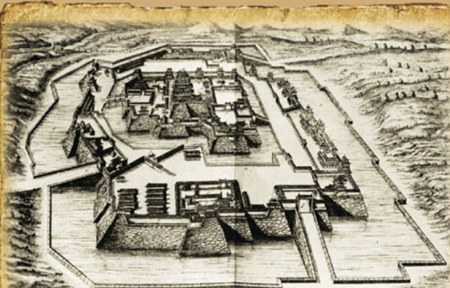
Схема замка Осака. По периметру стен располагаются башни ягура (в переводе - «хранилище для стрел»). Они являлись наблюдательными пунктами и местом хранения оружия, снаряжения и продовольствия

решил разорить его, прибегнув для этого к широкомасштабной акции по строительству замков по всей территории Японии. Даймё было предложено построить себе новые замки или укрепить старые — и те, конечно же, поспешили начать строительство, в результате чего архитектура Японии обогатилась, а очень многие из них вконец обанкротились! Однако клан Тоётоми оказался так богат, что, даже перестроив свой замок в Осаке, беднее не стал, что тут же подтолкнуло Иэясу к новым — причем весьма хитроумным — действиям.