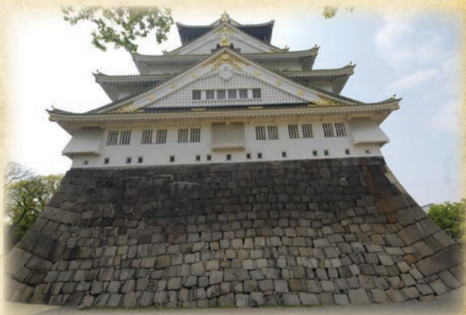
Вид на стену, сложенную из огромных камней, и главную башню замка. Нельзя не удивляться поистине огромным размерам каменных глыб, из которых были сложены стены осакского замка

2 ноября 1614 г. Иэясу приказал Хидэтада мобилизовать все войска, находившиеся вокруг его замка в Эдо, и точно такой же приказ получили и находившиеся там даймё. Его пятый сын Есиноа подждал с 15000 солдат в районе нового замка Нагоя. Потом войска начали покидать Эдо: Хидэтада с 50000 человек, Датэ Масамунэ, знаменитый «Одноглазый Дракон», с 10000, Усэсуги Кагэкацу, окончательно покорившийся Иэясу, с 5000 и Сатакэ с 1500. Вскоре вся Восточная армия численностью в 180000 человек — ровно в два раза больше, чем находилось в Осаке — собралась неподалеку от замка и была готова ринуться на штурм.