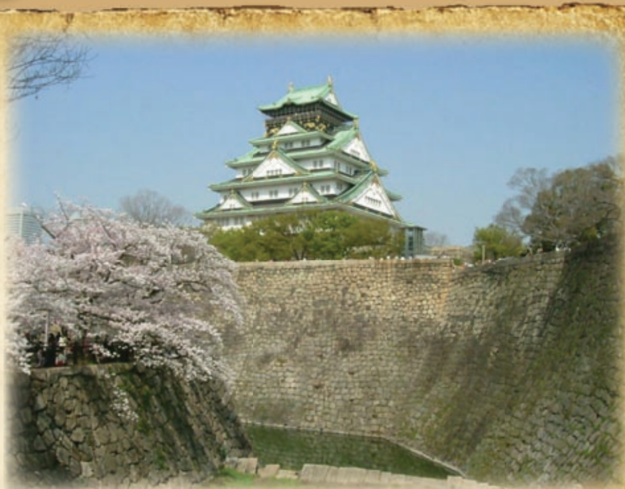
Внутренний ров и стена замка Осака, за которыми видна центральная башня - тэнсю (тэнсюкаку). Она являлась последним укрытием для осажденных и жилищем даймё и его семьи. Поскольку укладывались камни без связующего раствора, то угол наклона стен был довольно значительный

Готовясь к будущей осаде, Хидэёри еще больше укрепил замок, окружив его дополнительными рвами шириной 80 метров и глубиной 12, заполненными водой на 4-8 метров глубины! Позади этого рва была еще и стена высотой в 3 метра с установленной поверх нее крыши и бойницами для стрелков, вооруженных как луками, так и огнестрельным оружием. Перед воротами замка Хатомэ Санада Юкимура выстроил дополнительный бастион, получивший название бастиона Санада, также со рвом, хотя и сухим, и частоколом в три ряда: перед ним, позади и даже на самом дне рва! Защитники замка располагали артиллерией, купленной Хидэёри у голландцев, а каждые сто метров на стенах стояли еще и огнеметные баллисты. Гарнизон Осаки насчитывал до 90000 человек.