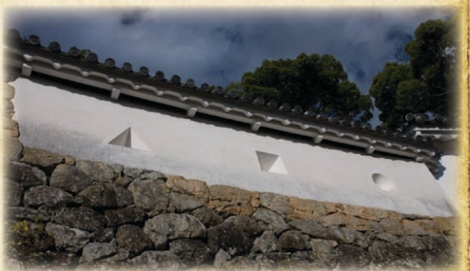
Бойницы для обороны