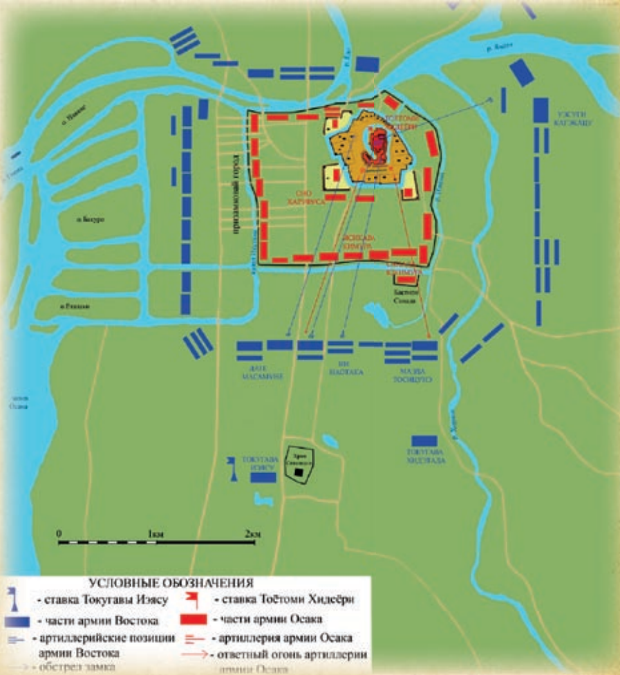
Осада Осаки. Зимняя кампания 1614-1615 гг.

жалостным образом, а вот в самурайских войсках эту функцию выполняли самураи младших рангов и пехота асигару. Можно