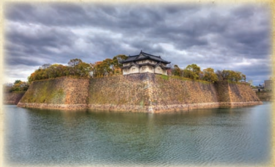
Угловая башня Инуи на северо-западном углу внешней стены. Внешний ров

Сам Хидэёри сначала не придал всему этому значения, причем в такой степени, что даже отказался от партии пороха, который был, разумеется, тут же куплен Иэясу. Потом он купил еще и четыре 18-фунтовых английских орудия и одну 5-фунтовую пуш-