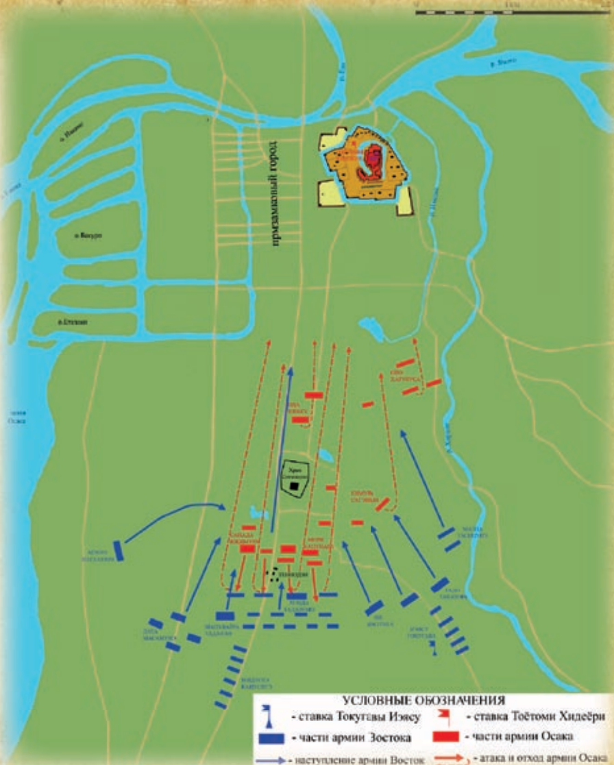
Летняя кампания 1615 г.

Таким образом, в возрасте семидесяти четырех лет, приняв