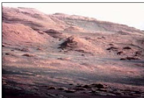
Один из снимков поверхности Марса, переданных планетоходом «Curiosity».

Не хватает достоверных сведений о необходимых ресурсах марсианского корабля и о воздействии длительного автономного полёта (около двух лет) на психику и физиологию экипажа. Недавно завершившийся эксперимент «Марс-500», призванный частично решить тревожащие вопросы, принёс спорные результаты.