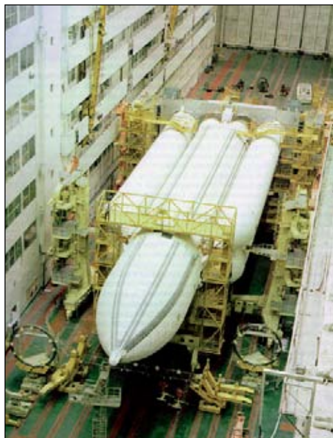
Ракета-носитель «Энергия» в монтажно-испытательном корпусе.

кий удар, и с тех пор они очень осторожны в суждениях. Но и конструкторам ракетно-космической техники, мечтавшим о колонизации ближайших миров, пришлось задуматься: ни одна из ранних стратегий освоения Солнечной системы не вписывалась в суровую реальность. Кроме того, требовались дополнительные данные о воздействии космических факторов на живых существ, прежде всего — о влиянии невесомости, которая продемонстрировала своё коварство, как только начались длительные полёты (см. статью «Жизнь в космосе, или Кто полетит на Марс?», «Наука и жизнь» № 4, 2010 г. — Прим. ред. ). О быстром покорении планет и межзвёздной навигации пришлось пока забыть.