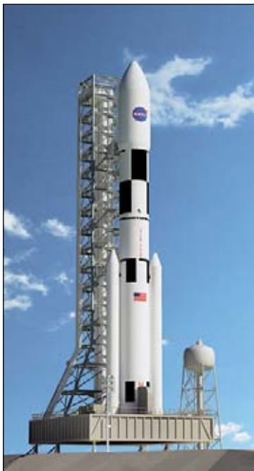
Перспективная американская ракета-носитель SLS (художественная реконструкция).

ходится сомневаться, что экспедиция на Красную планету затмила бы программу «Saturn-Apollo». Одна проблема: ни Советский Союз, ни Россия не были готовы к такой экспедиции.