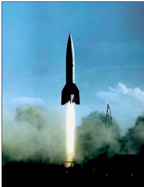
Старт немецкой баллистической ракеты «А-4/В-2».

космонавт. И уже 1 ноября 1962 года был запущен аппарат «Марс-1», который продемонстрировал принципиальную возмож-