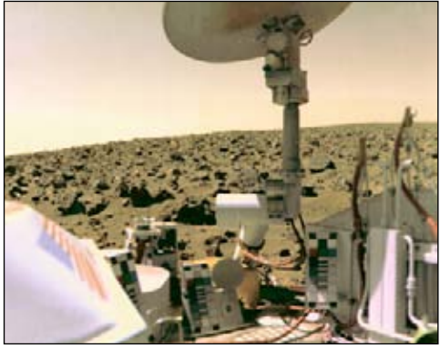
Снимок поверхности Марса, переданный аппаратом «Viking-2».

Мягкая посадка планетохода «Curiosity» на Марс с помощью «небесного крана» (художественная реконструкция).