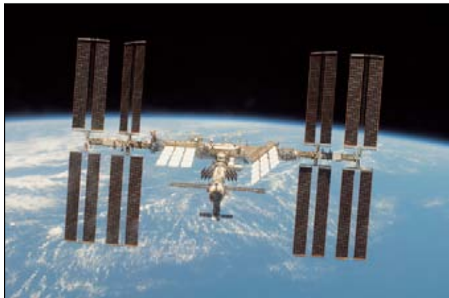
Международная космическая станция в полёте.

Альтернативная программа Огастина нацелена, прежде всего, на изучение и освоение малых тел Солнечной системы. На первом этапе астронавты должны побывать в точке Лагранжа системы Земля—Луна, где есть шанс найти небольшие космические обломки (к примеру, в точке L4, на расстоянии 25 млн км от Земли, астрономы открыли 300-метровый «троянский» астероид 2010 TK7). Затем состоятся полёты к околоземным астероидам из группы «аполлонов»: 2007 UN12 (миссия займёт 190 суток) и 2001 GP2 (300 суток). Будут совершены высадки астронавтов на поверхность, установлено научное оборудование, изучен химический состав грунта и собраны его образцы. Первый такой полёт может состояться уже в 2025 году. Среди дальнейших планов «Гибкого пути»: облёт на пилотируемом корабле Марса и Венеры без высадки на поверхность (440—490 суток), высадка на спутники Марса (780 суток). Экспедиции