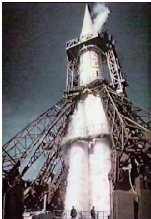
Созданная в СССР ракета-носитель «Р-7» на старте.

ность полёта к дальним планетам Солнечной системы.