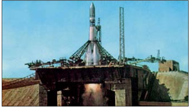
Запуск ракеты-носителя «Восток».

Но наука о Вселенной заметно отставала от технологии. Когда первые межпланетные аппараты отправились к Венере и Марсу, астрономы всё ещё полагали, что эти планеты пригодны для жизни. Даже бесплодная Луна рассматривалась как ценный источник ресурсов: на ней предполагали найти массу полезных ископаемых. Во многом планы освоения Солнечной системы опирались в начале 1960-х годов исключительно на гипотетические теории учёных и фантазии популяризаторов, а не на точное знание.