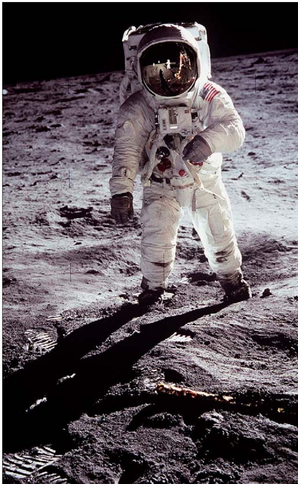
Эдвин Олдрин на Луне (снимок сделан Нейлом Армстронгом).