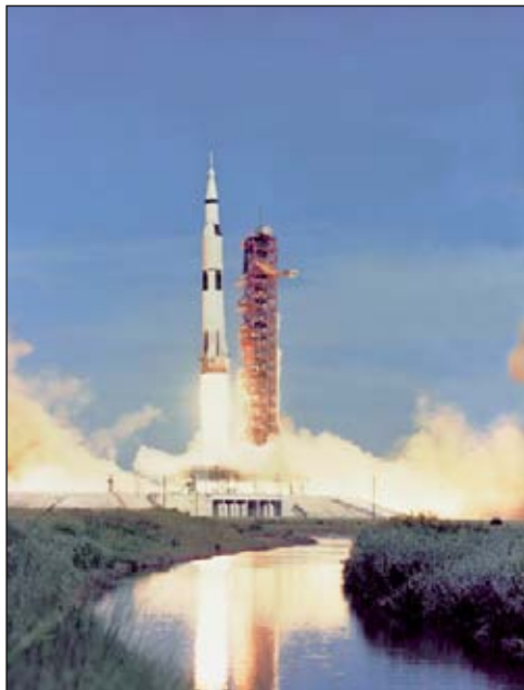
Старт американской ракеты-носителя «Saturn V» с кораблём «Apollo-15».

казали, что там царят чудовищно высокие температуры и давления, а её плотная атмосфера состоит в основном из углекислого газа.