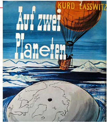
▲ Обложка книги «На двух планетах»

В НАУЧНОЙ ФАНТАСТИКЕ ЧЕЛОВЕЧЕСТВО ДАВНО УЖЕ КОЛОНИЗИРОВАЛО МАРС И ДВИНУЛОСЬ ДАЛЬШЕ, ЗА ПРЕДЕЛЫ СОЛНЕЧНОЙ СИСТЕМЫ – искать пришельцев, новые источники энергии или любовь. В 1897 году немец Курд Лассвиц написал роман «На двух планетах», в котором представил марсианское общество более развитым, чем наше, а мир Красной планеты – утопичным государством с характерным названием Соединенные Штаты Марса. Марсиане в его книге решили проблему голода, создали роботов, чтобы обслуживать города, и прилетели на Землю с добровольческими инициативами. Лассвиц видел мир Марса не пустыней, а более прогрессивной цивилизацией под боком у нашей. Его марсиане попытались навязать свой прогресс Земле, но коалиция земных стран подарок не оценила и начала войну. Закончилось все, конечно, хорошо: марсиане ушли, а марсианские ценности остались.