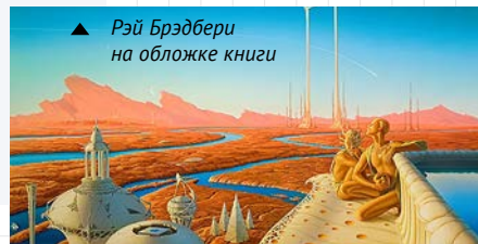
▲ Рэй Брэдбери на обложке книги