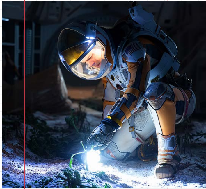
▲ Кадр из фильма «Марсианин»

которые фильмы того времени, в названии которых читается основная мысль. К счастью, она не получила в кино повсеместного распространения. О Марсе снимали и снимают другие картины. В 1970-х годах марсианская программа «Викинг» доказала, что Марс не обитаем. Голливуд сосредоточился не на захватчиках с Марса, а на его колонизации людьми. «Вспомнить все» (1990), «Красная планета» (2000), «Джон Картер» (2012), «Последние дни на Марсе» (2013) – новая волна произведений о Красной планете посвящена деятельности там людей. Режиссеры в каком-то смысле наследуют Брэдбери. «Марсианские хроники», кстати, тоже экранизированы. Но венцом «марсианской лихорадки» считается фильм Ридли Скотта «Марсианин». Исследовательская группа NASA оставляет на Марсе одного из колонизаторов, и тот вынужден в одиночку выживать – конечно, не на поверхности планеты, а внутри базы ученых, где главный герой выращивает картошку, чтобы чем-то питаться, и не теряет надежды связаться с Землей. На месте Марса в этой истории могла быть любая другая планета, но пустынные пейзажи нашего космического соседа всегда оттеняют романтизм повествования. Любимый герой на безжизненном Марсе еще более одинок, чем где-либо.