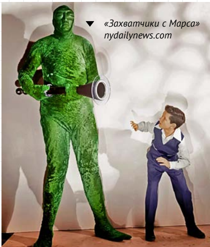
▼ «Захватчики с Марса»