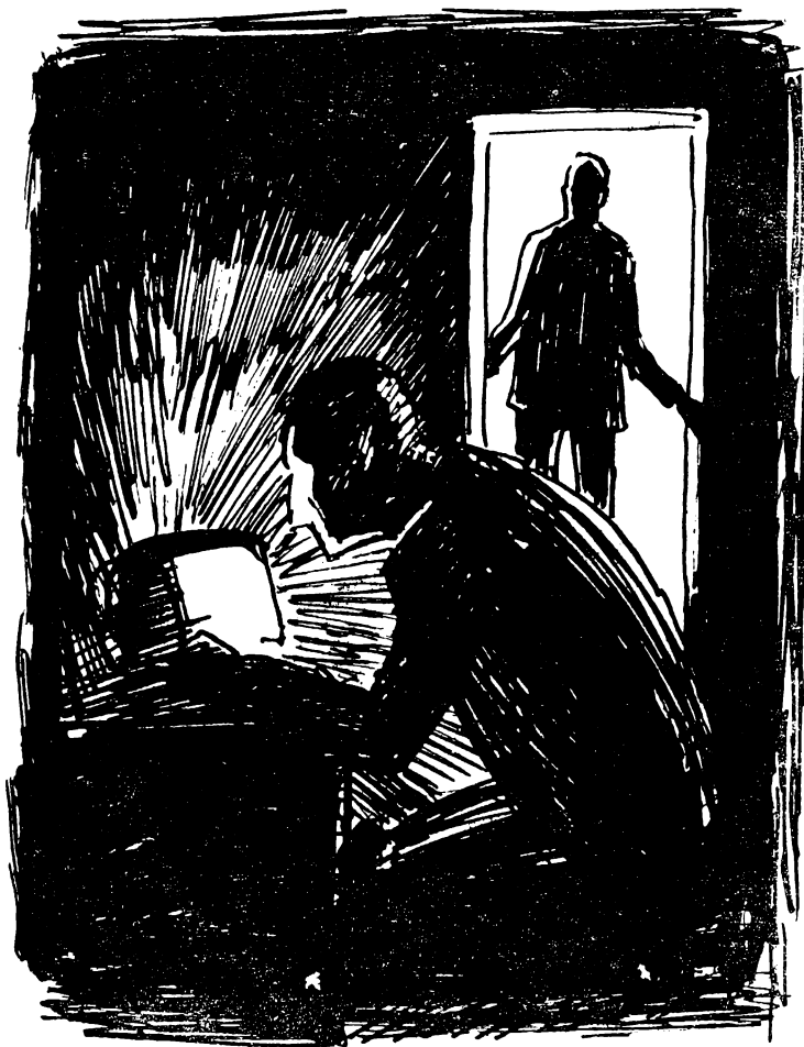
Рисунки Б. ДОЛЯ

По дороге в аптеку я остановился возле лавки с канцелярскими товарами, купил книжку с бланками расписок и тут же