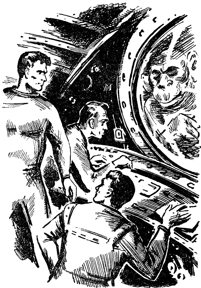
Рисунок Г. КОВАНОВА