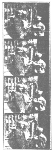
Fig. 2. Filmstreifen mit „Kinamo“ aufgenommen.

Ausstattung sonst allen Ansprüchen genügt. Als derartiger Apparat, der kleinste Ausmaße mit guter Ausstattung verbindet, ist der seit einiger Zeit im Handel befindliche „Kinamo“ der Ica A.-G. Dresden zu nennen. Die Abbildung zeigt einen solchen