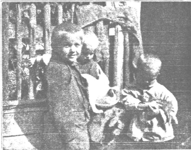
Fig. 3. Vergrößerung einer „Kinamo“-Aufnahme.

stens 6—10 m Film auf einmal. In allen Fällen genügt dem Amateur ein Apparat, der 15 m Film faßt, wenn derselbe in Ausführung und