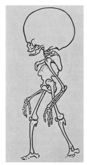
Das Skelett eines Menschen der Zukunft? Nein, nur die düstere Phantasie gewisser Wissenschaftler

Das aufrechte Gehen erhöhte die Möglichkeit der Umwelterkenntnis, füllte das Gehirn mit neuen sinnlichen Signalen und förderte dadurch dessen Vervollkommnung. beim Neandertaler erreichte das Gehirn etwa die gleiche Größe wie beim modernen Menschen (im Durchschnitt