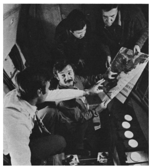
Die Multispektralkamera MKF 6, mit der die Aufnahmen von einem Satelliten aus gemacht werden, hier an Bord eines Forschungsflugzeuges